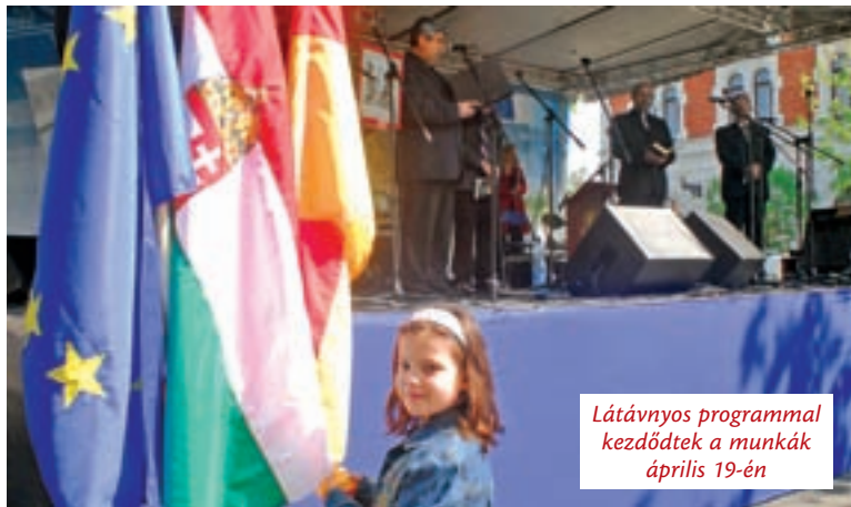
Látványos programmal kezdődtek a munkák április 19-én