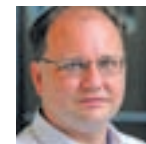
WINTERMANTEL ZSOLT (Fidesz):

sére tudnánk fordítani. Az MSZP-frakciónak volt a létszámcsökkentésre konkrét javaslata, de a többi frakció nem tudott ebben megegyezésre jutni. Sajnálatos, hogy a frakciók nem tudtak megegyezni sem a testületi ülésen, sem az azt megelőző frakcióvezetői egyeztetésen. Mivel január 31-ig kötelezte a törvény az önkormányzatokat a döntés meghozatalára, s ez nálunk addig bizonyosan nem történik meg, mulasztásos törvénysértést követtünk el, melynek félt, hogy következménye is lesz az önkormányzatra nézve.