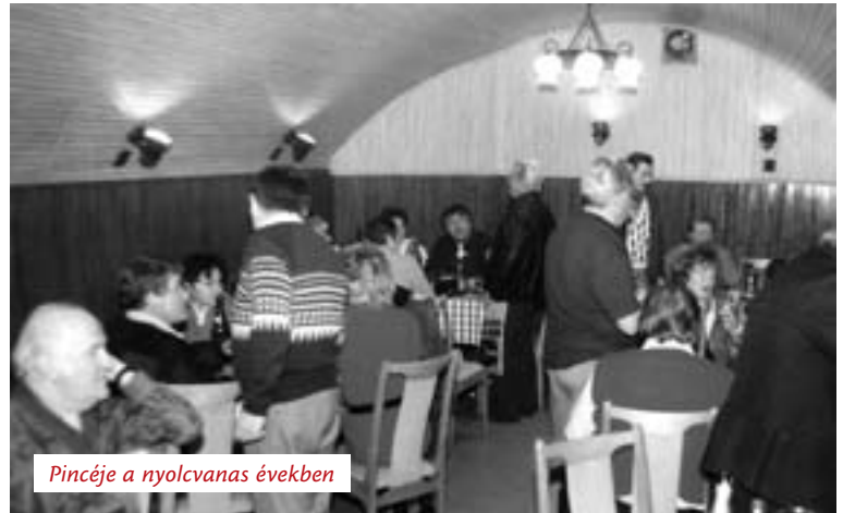
Pincéje a nyolcvanas években