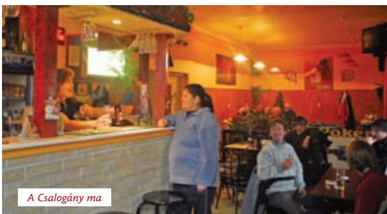
A Csalogány ma