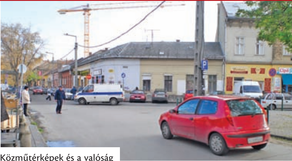
Közműtérképek és a valóság