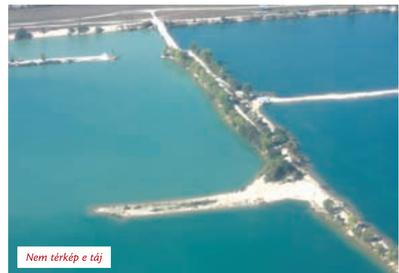
Nem térkép e táj