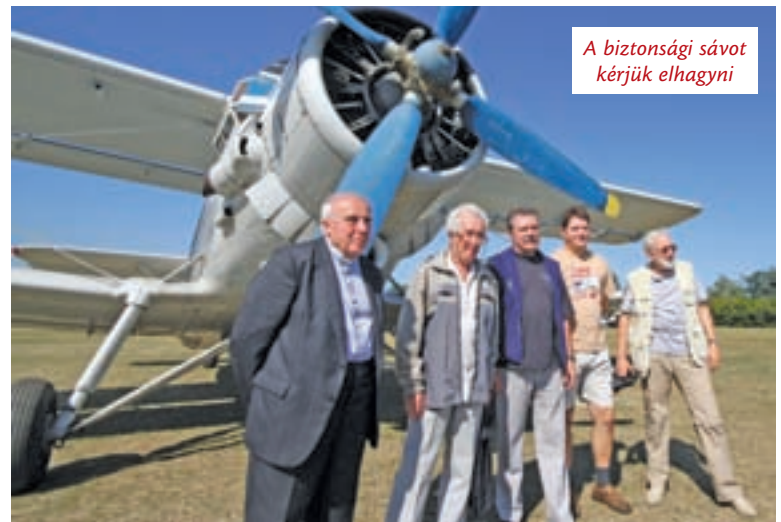
A biztonsági sávot kérjük elhagyni

Köszönjük a lehetőséget, mindannyiunknak különleges élményben volt része ezen a csodálatos szeptemberi szombaton.