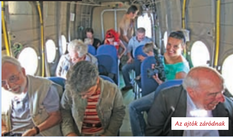
Az ajtók záródnak