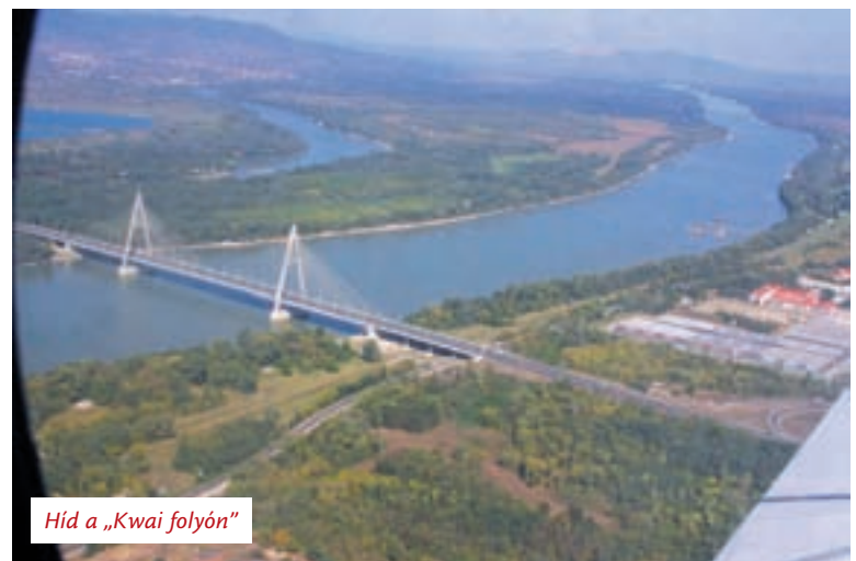
Híd a „Kwai folyón”