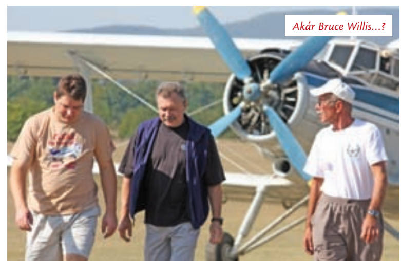
Akár Bruce Willis...?