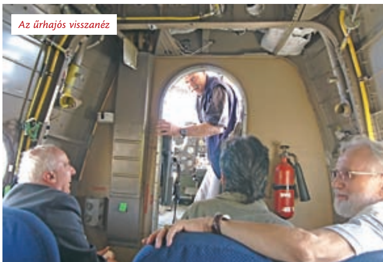
Az űrhajós visszanéz