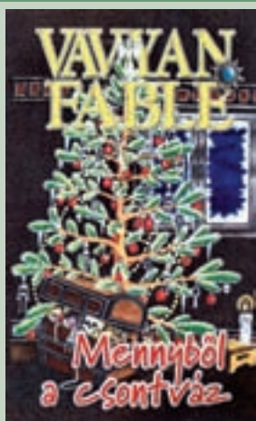
2. Vavyan F. : Mennyből a csontváz