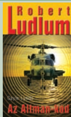
4. R. Ludlum: Az Altman-kód