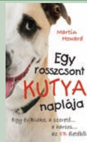
5. Egy rosszcsont kutya naplója