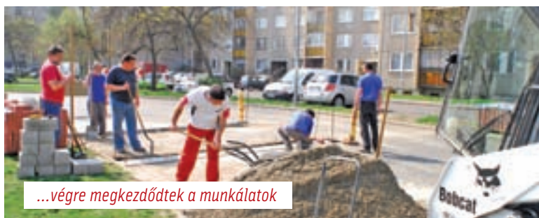
...végre megkezdődtek a munkálatok