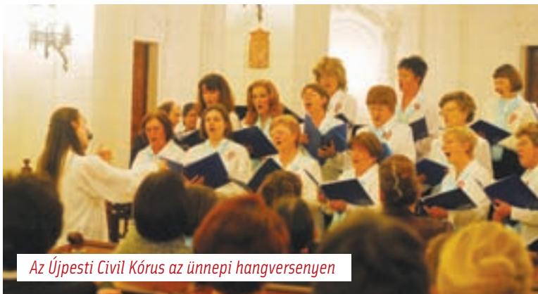
Az Újpesti Civil Kórus az ünnepi hangversenyen