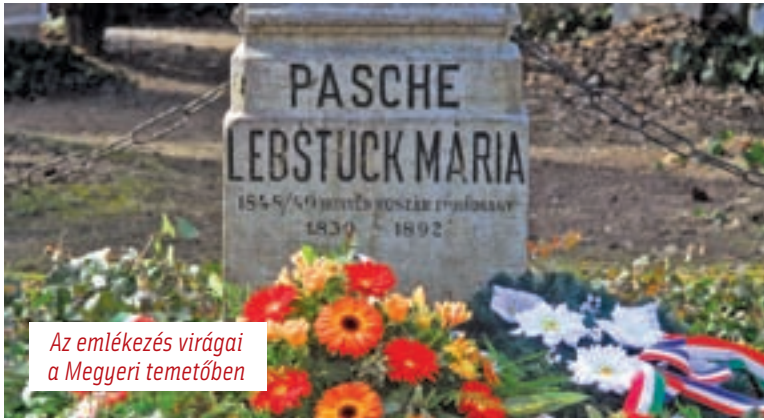
Az emlékezés virágai a Megyeri temetőben