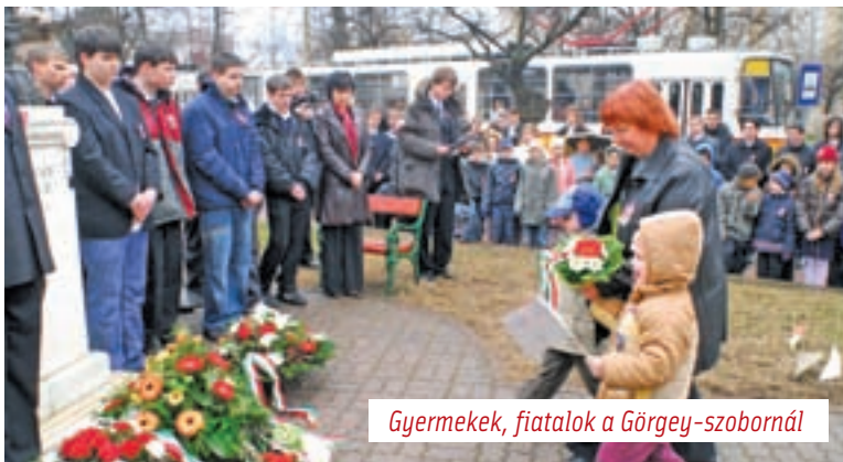
Gyermekek, fiatalok a Görgey-szobornál