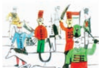
– Engeadj, zászlórúd! Mért markolsz vissza a széltől? – Rongy lennél egyedül. Így lobogó, lobogó.

A hagyományos osztálykeretek felbomlanak. Helyüket – azonos létszámú, de különböző életkorú gyerekekből toborzott zászlóalj veszik át. Irányítóik a tábornokok, gyermekösszekötőik a