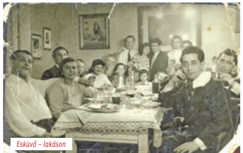
Esküvő – lakáson