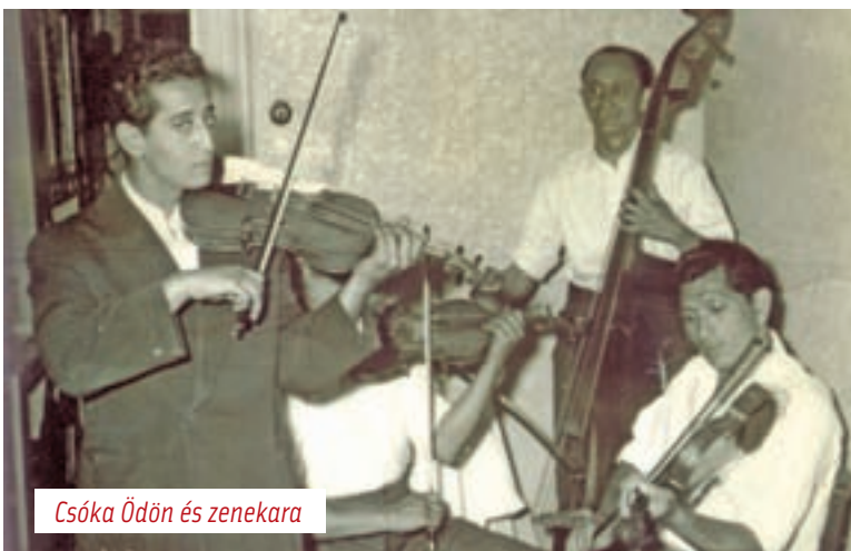
Csóka Ödön és zenekara