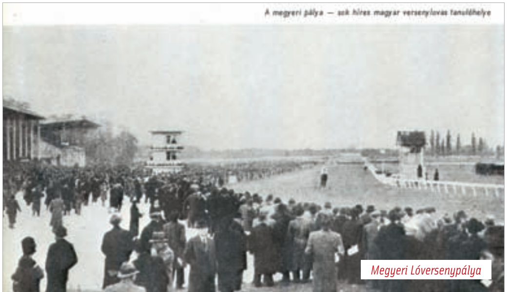
A megyeri pálya — az híres magyar versenylovás tanulóhelye