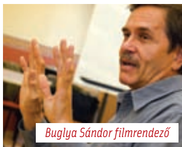
Buglya Sándor filmrendező

gével. Minden évben más-más hivatás – szakterület alkotói a vendégeink. Most a VII. Nevelésügyi Kongresszushoz kapcsolódóan, pedagógusokról portréfilmek készültek. A program délelőtti foglalkozásain filmelméleti, esztétikai, és a filmkészítéshez közvetlenül kapcsolódó előadások váltják egymást. Visszatérő téma a filmtervek, ötletek tartalomfejlesztése. Délután a gyakorlati alkalmazások, valamint a felvétélkészítés a terep. Este a ci-