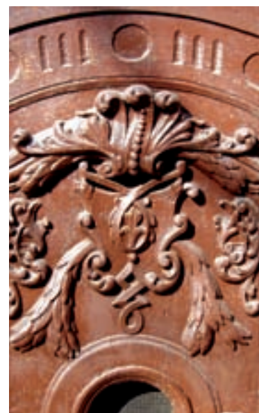
A kapu részlete