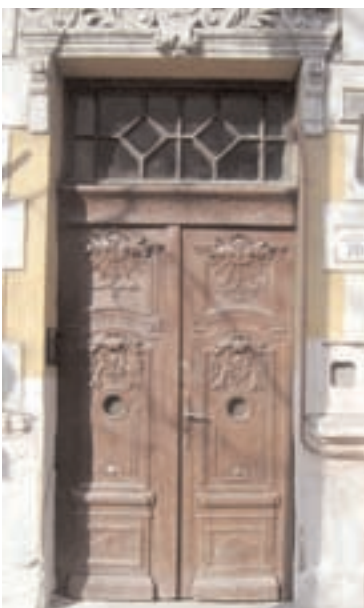
A díszes bejárati kapu