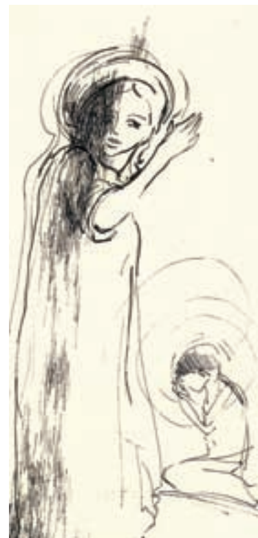
Kisgyermek anygallal (tusrajz)

sége nyílt a Velencei Biennálén is bemutatni festményeit. Előtte a berlini Magyar Intézetben rendezett csoportos kiállításon állíthatta ki grafikai sorozatát. Szerény ember, aki elszánt tudatossággal, programszerűen készíti munkáit. Tervezgeti, hogy beiratkozik a képzőművészeti doktori képzésére. A tandíjra gyűjt, de nem hajlandó divatfestő lenni, pedig tudja miket és hogyan kellene pingálni ahhoz, hogy meglegyen a pénze. Ő inkább alkot.