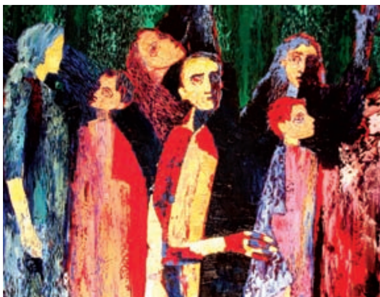
J. A. Nagyon fáj (olajfestmény)

sége nyílt a Velencei Biennálén is bemutatni festményeit. Előtte a berlini Magyar Intézetben rendezett csoportos kiállításon állíthatta ki grafikai sorozatát. Szerény ember, aki elszánt tudatossággal, programszerűen készíti munkáit. Tervezgeti, hogy beiratkozik a képzőművészeti doktori képzésére. A tandíjra gyűjt, de nem hajlandó divatfestő lenni, pedig tudja miket és hogyan kellene pingálni ahhoz, hogy meglegyen a pénze. Ő inkább alkot.