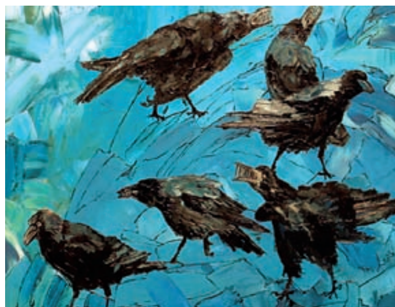
A hatalom (olajfestmény)