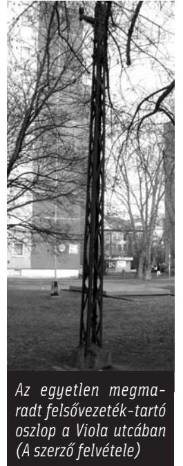
Az egyetlen megmaradt felsővezeték-tartó oszlop a Viola utcában

Utunkat a Károlyi-féle kórház előtti megállónál szakítottuk félbe. A Viola utcából a másik sínpáron villamos érkezik: az E kocsis, mely megállás után az Ősz utca felé halad tovább, ellentétesen a mi D járatunkkal. Itt jegyzem meg, hogy a teljes vonalon kettősvágányú pálya fekszik, az átlag 11 méter széles utcák hétméternyi szélességű úttestén lévő két sínpáron két vaskerekű rendben elfér egymás mellett. Negyedórai várakozás után a Kórház utcai kanyarból előbukkan a következő D jelzésű kocsis. Felszállunk rá, és már indulunk tovább a Viola utcán északi irányban. Az iskola másik végénél, a Tavasz utca torkolatánál is megállunk, majd egyenesen Újpest főútjára, az Árpád út felé haladunk. Most pedig, kedves Útitársam, felhívom figyelmét e vonal egyetlen megmaradt tárgyi emlékére, melyet – a kocsis ablakán jobbra kitekintve – a jelenlegi Viola Óvoda közelében láthat: egy több mint százszázados felsővezeték-tartó oszlop olvad bele a környezetbe. (Társai az itteni villamosközlekedés megszűnése után még jó néhány évtizedig álltak, tápvezetéküket hordozták magukon. Később feladatukat veszítve elbontották őket – ám e példányról szerencsére megfeledeztek.) Következő megálló az Árpád út torkolata előtt van.