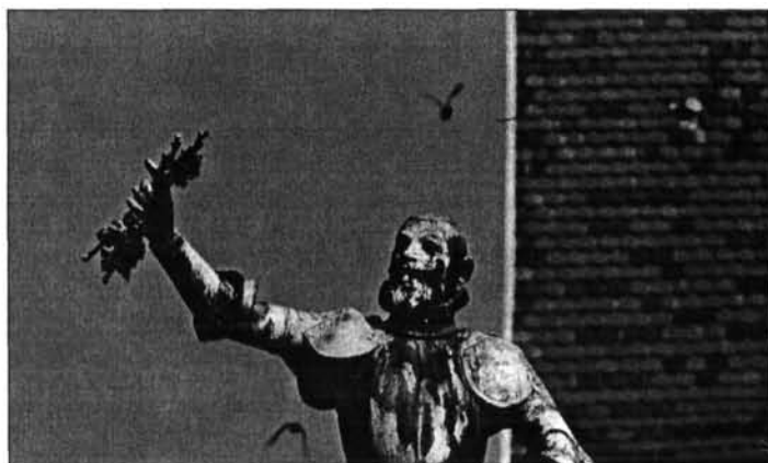
9. kép. A Schwendi-díszkút részlete

Így a város elvárásának megfelelően kerül a páncélba öltözött vitéz magasba emelt jobb kezébe a jelképes szőlővessző. Bartholdi elfogadta a változtatást, viszont ragaszkodott a város legpatinásabb teréhez, a régi vámház-térhez, melynek középkori hangulatát a favázas épületek és az árkádsorok szolgáltatják. E műben a historikus szoborállítás egy szép példáját látjuk, hiszen a szobor szinte egyidősnek látszik környezetével. Ami mégis árulkodik keletkezési idejéről, az az „eredeti” posztamens és a díszkút egyéb művészi kelleke: vízköpek, medence, rácsozat. A mű egészének valami zsánerszerű közvetlen hangulata van. Lendületes léptekkel érkezik a kapitány, sisakja már mellette pihen, s a legfőbb „hadizsákmányt” ravaszkas mosollyal magasra tartja. A korosodó Bartholdit már nem feszíti a fiatal korára jellemző magasztosság, minden elvárásnak eleget tevő művel ajándékozza meg övéit, amiből végül is Elzász egész története levezethető. Számunkra külön öröm, hogy mindennek köze van a magyar szőlő- és borkultúrához.