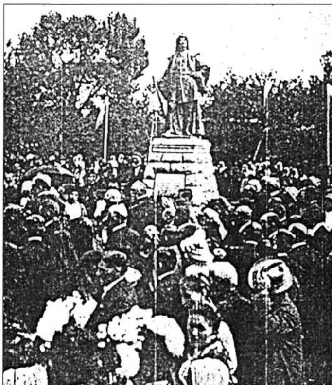
3. kép. Ismeretlen eredetű sajtófotó a sajógömöri szobor avatásáról

nem kerülhette el Holló figyelmét sem, de ő még historikus művész, akit e modern gondolat a mese fedezéke mögé rejtőzve érintett meg.