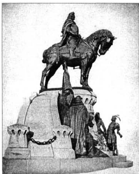
1. kép. Fadrusz János: Mátyás-szobor, 1895–1902. (Kolozsvár)

Mátyás király uralkodói rezidenciáját a művelt Európa csodálattal illette. Ezért nem véletlen, hogy amikor a 19. században az egykor volt dicsőség felemlegetésére került sor, annak a reneszánsz uralkodónak emléket állítottak, aki a nemzetállam megteremtéséért és felvirágoztatásáért a legtöbbet tette. A „honi szobrászat ügyében keletkezett társaság” 1840-ben adta a megbízást Ferenczy Istvánnak a Mátyás-émlékműhöz. De ekkor még a reformkori lelkesedés csak a kisminta elkészíttetéséhez volt elegendő. A dualizmus korában – bizonyos fokig érthető módon – nem Mátyással indul meg a közteri emlékművek sora, hanem József nádorral, de még ő sem a Bécsben szokásos neobarokk lovas emlékművet kapja, hanem gyalogosan ábrázolt portré készül róla. 5 Az első valódi, reprezentatív uralkodói emlékmű hazánkban a koronázó városban, Pozsonyban, Mária Terézia-lovasszobra. Fadrusz János mintázta és 1997-ben lep-