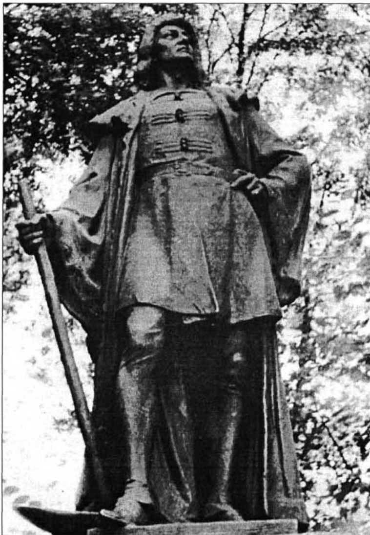
2. kép. Holló Barnabás: Mátyás király, az igazságos, 1912–14. (Sajóörmör)

lapok képes tudósítást adtak, de a közvélemény figyelmét ekkor már egy másik esemény, a trónörökös házaspár meggyilkolása kötötte le. 7 (Még Lyka Károly is kihagyja abból a felsorolásból, amit 1914-gyel bezárólag oly pontosan lefektetett a magyar köztéri alkotásokról.) De e mű az anyaországra koncentráló művészettörténeti írásokból is kimarad, hiszen a helyszín – ahova eredetileg is készült – ma már Szlovákiához tartozik. Az utóbbi évtizedek „Gömörországról” szóló kiadványaiban