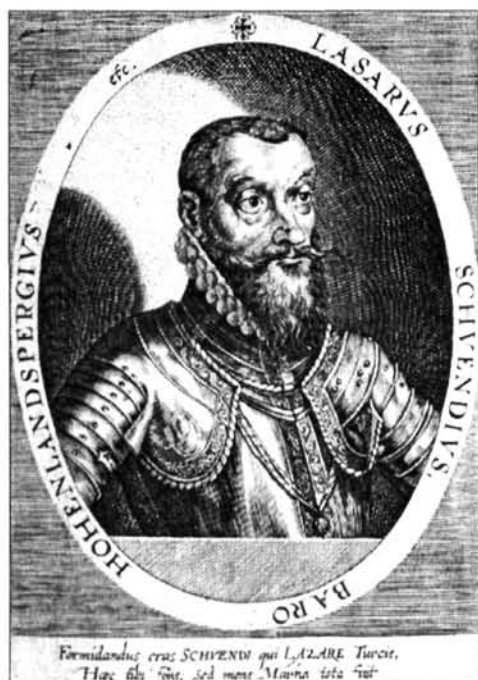
6. kép. Schwendi-arckép korabeli metszeten

cserélt gazdát. A szabadság és forradalom eszméjének szimbólumává vált, hiszen már a 14. században a feudális uralom ellen szövetkezett városok központja volt, s később a francia vagy német birodalomhoz való tartozás valójában a független fejlődést biztosító garanciát próbálta szavatoltatni a városnak. Frédéric-Auguste Bartholdi (Colmár, 1834.–Párizs, 1904.) szobrászművész minden tehetségét e szabadság-eszmény szolgálatába állította (Rapp tábornok lovas szobra, Colmár, 1855.; Oroszlán, Belfort, 1878.). Amikor Elzász 1871-ben Németországgé lett, elhagyja hazáját, s az Egyesült Államokba költözik. A két nép, az amerikai és a francia barátságát kifejező műveket alkot, melynek gigászi méretekben megvalósult legismertebb darabja a New York-i Szabadság-szobor (1886). Az ember alapvető jogáért való küzdelem áthatja Bartholdi egész egyéniségét, olyannyira, hogy a New York-i kolosszus ötlete is tőle származik, s a gyűjtést is ő maga kezdi el Franciaországban. (Az építészeti léptékű szobormű statikusa Eiffel volt.)