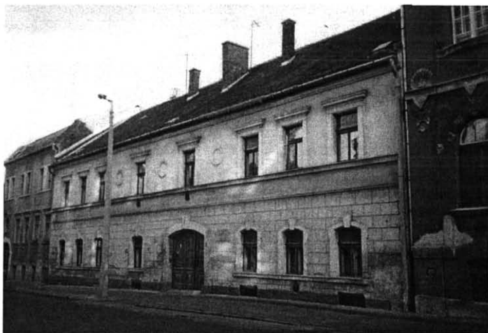
1. kép. A gimnázium épülete (a képek a szerző felvételei)