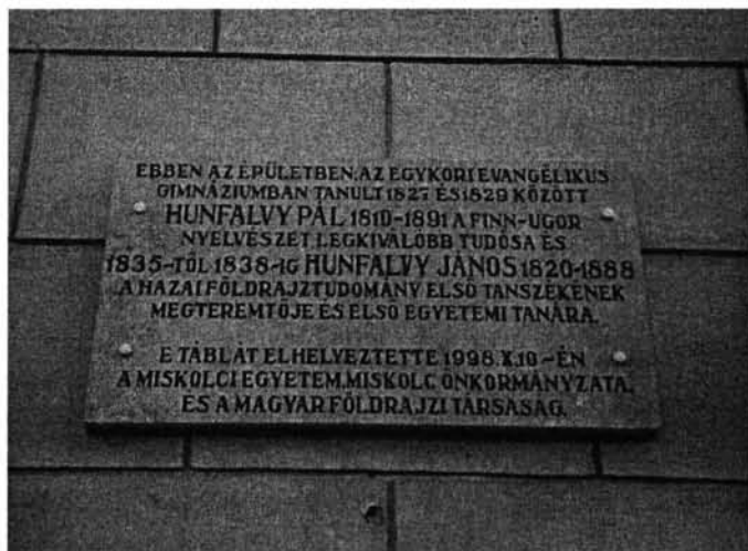
3. kép. A két Hunfalvy emlékére elhelyezett emléktábla az épület falán

HUNFALVY PÁL, az újkori összehasonlító finnugor nyelvészet egyik megalapítója. 1827-ben a magyar nyelv elsajátítása miatt Miskolcra küldik az evangélikus gimnáziumba. Két évet töltött itt.