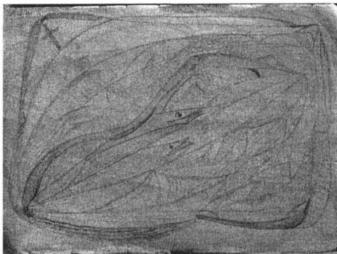
1. kép. „A rossz is bennünk van, és ezek ilyen tengeri ragadozó halak”

A képek meglehetősen egyszerű kivitelű, félfamentes rajzlapra készített ceruzarajzok. Az ábrák vonalvezetése folyamatos, íves, szögletek, sarkok, sőt egyenes vonalak egyáltalán nem jellemzőek. Ennek köszönhetően a képek szinte folyékonyak, a rajtuk felfedezhető és konkretizálható formák nem rendelkeznek éles kontúrokkal, egymástól sem igen határolhatóak el. Ilyen módon a grafikák leginkább víziókat, álmokat idéznek a néző számára. A laza kézmozdulatokkal meghúzott vonalakat M. néni feltehetően utólag erősítette ki.