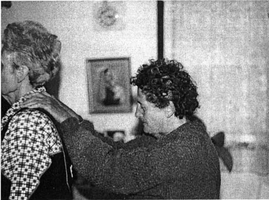
4. kép. „...Általában ezek az emberek is Istenhez tértek meg.” M. néni gyógyít, háttérben a szentsarok

gyulladás. Félóráig voltam az esőn, s így bugyborékol a víz...Biciklivel voltam. Hazajöttem, mondom én borzasztóan át vagyok ázva. Vetkőzők le, minden száraz volt rajtam, a fejkendőn egy csepp nem volt, a kabáton egy csepp sem volt, csak bokáig voltam tatyakos.”