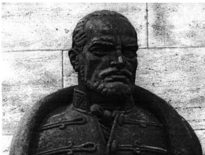
Sidló Ferenc: Görgy Artúr szobra