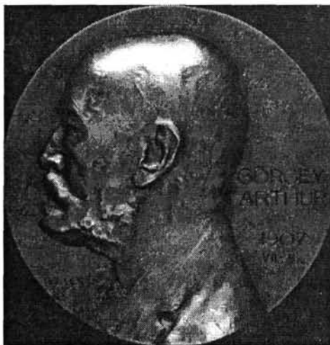
Telcs Ede: Görgey-plakett (1907)

1930-tól ismételt lendületet vett a Görgey-kultusz. Ennek társadalmi okát nem feladatunk boncolgatni, inkább figyeljük meg az ahhoz kötődő ikonográfiai változásokat. 1934-ben – az országban elsőként – került köztéri elhelyezésre Miskolcon a Sidló Ferenc által mintázott mellszobor. 15 Ezt gyakorlatilag csak egy követte, az ifj. Vastagh György (1868–1946) által készített és a budai Bástya sétányra kihelyezett lovas szobor. Ez utóbbit 1935-ben avatták és 1945-ben már meg is semmisült (vagy részleteiben lappang valahol)*.