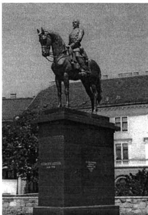
Ifj. Vastagh György: Görgey lovas szobor rekonstrukció (1934–1998)

szerint vörös zubbonyát viselte, s amint a komáromi, ószönyi csataképek mutatják, tollas tábornoki kalapját a figyelem felhívására használta és azt a magasban lobogtatta. 19 Méltóságának kijáró rangjelzőjét tehát nem tekinthetjük jellegzetes darabjának, mára az Bem József tábornok attribútumává vált. (Lásd: Istók János: Bem-szobor, Budapest, 1934.)