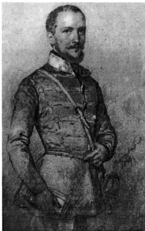
Barabás Miklós: Görgey Arthur (1849)

Görgey a másik, az ismeretlen műtremből való felvételen is lemond a militáris attribútumokról, de némiképp „katonásabban” – atillája nyílásában nyugtatja kezét (lásd Napóleon-ábrázolások). Ebből a lefegyverzettségből igen jellemző magatartás olvasható ki. A gyermekkorától hadiiskolában nevelkedett Görgey később a katonáskodást nem választotta hivatásának. Természettudománnyal, kémiával foglalkozott, s csak a történelmi pillanat készítésére adja sokrétű tudását és szervezőképességét a szabadságharc javára. Sokkal inkább egy mundért viselő polgár, mint az oktalan virtusokért fegyvert rántó katona benyomását kelti. 4