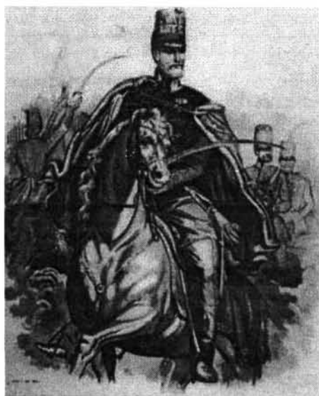
Tyroler József: Görgey Artúr (színezett rézmetszet)