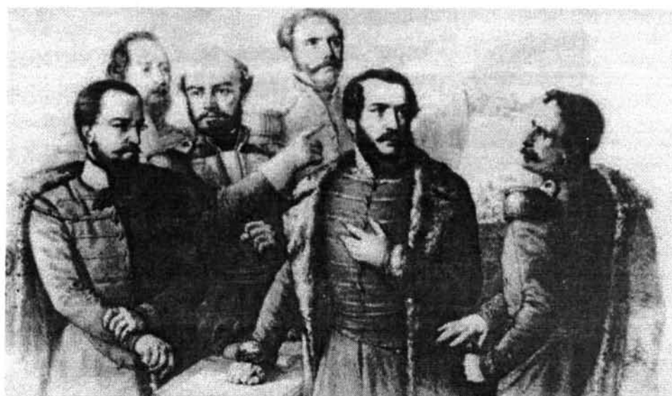
A. Colette: Magyarország utolsó támaszai (1849)

részletek láthatók. A Kossuth-bankókat metsző Tyroler József is egy csataképi háttér elé applikálja a fehér lován ülő, dicsőséges Görgeyt. De ez már a nemzeti romantika