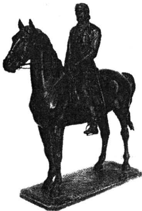
Holló Barnabás: Görgey sebesülése után (1898)

Mint idáig látható volt, Görgeyt szinte kizárólagosan fedetlen fővel ábrázolták. Than Mór, aki a hadmozdulatok alkalmával is testi közelében volt, többféle öltözékben – nem hordott szabályos uniformist – örökítette meg. Fennmaradt róla; a csatákban rend-