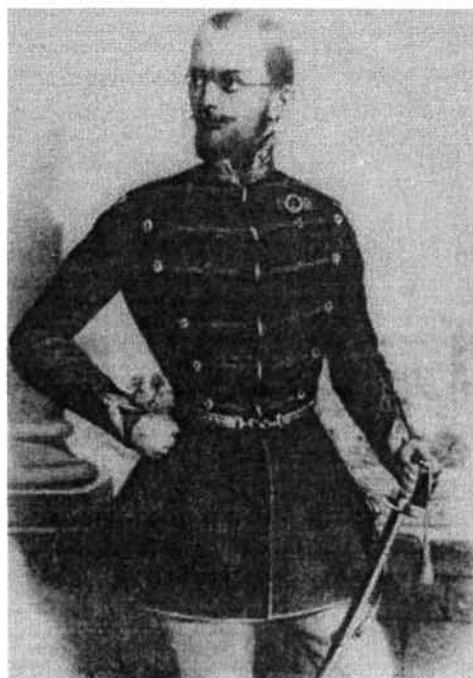
Krauser rajza nyomán: Görgey hadügyminiszter hivatalos arcképe