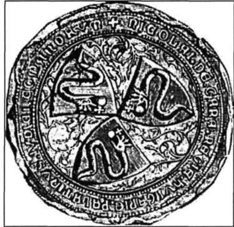
2. kép. Garai Miklós nádor pecsétje (Csoma 1214.)

A közgyűlések harmadik célja a polgári és bűnügyekben való igazságszolgáltatás volt. Mivel a király arra törekedett, hogy a peres feleknek ne kelljen az olykor nagyon távoli királyi kúriát felkeresniük, hanem a nádor rendszeresen végigjárva az országot tartson törvényszékeket, ezért a „mindennapos” ügyek kerültek leggyakrabban terítékre. Így szép számmal találkozunk Gömör és Torna megyék fórumain birtokperekkel. Gyak-