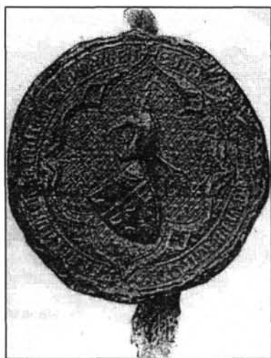
3. kép. Drugeth Fülöp nádor pecsétje (MNT. III. 92.)