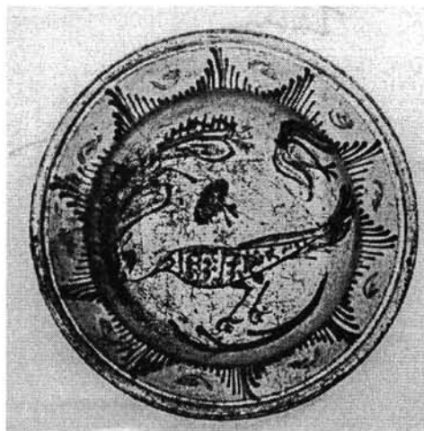
9. kép. Madaras tál (HOM 53.212.1.)

Egy újabb tárgy, egy harmonikus megfogalmazású kásástál a butellán szereplő, még kissé ügyetlen, fejjel lefelé felkarcolt madár alapján azonosítható. 23 A madár rajzolata a két tárgyon minden elemében megegyezik, a butellán karcolva, a tálon írókázva egyaránt lendületes. A világosokker tálal szintén szintelen máz borítja, színezése a miskakancsókéhoz hasonlóan barna, vörös, zöld és sárga. Peremét háromszögbe rendeződő eltérő színezésű vonalak díszítik. Közepén ágat jelképező hármis barna íven áll a nyújtott vonalú elegáns madár (9. kép). Hosszú csőrében a tányér ívét követő gránátalmás, tulipános ág nyúlik háta mögé. Testén függőleges vonalak, hullámvonalak és pettyek jelzik színes