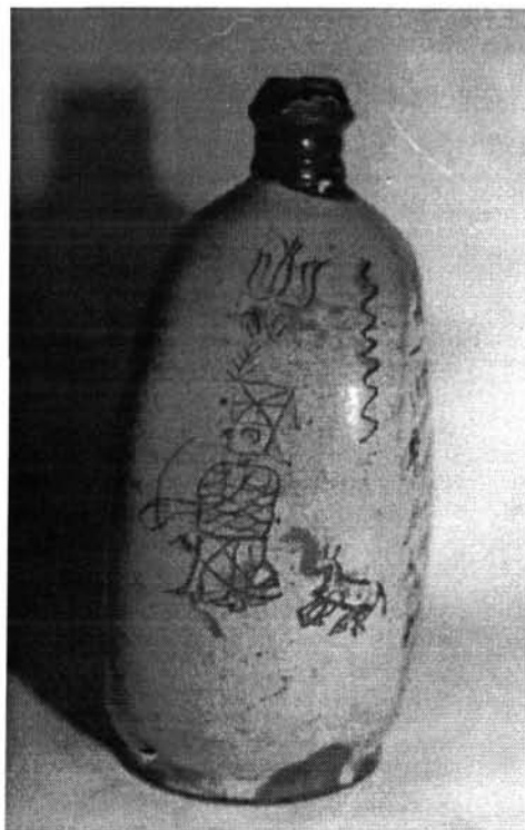
2. kép. A butella oldala (NM 94.107.28)