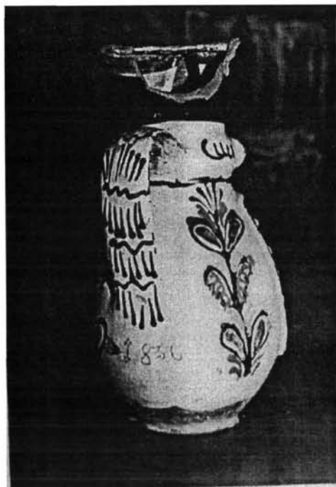
5. kép. 1836-os miskakancsó hátlapja (Szabadtéri Néprajzi Múzeum 78.33.1.)