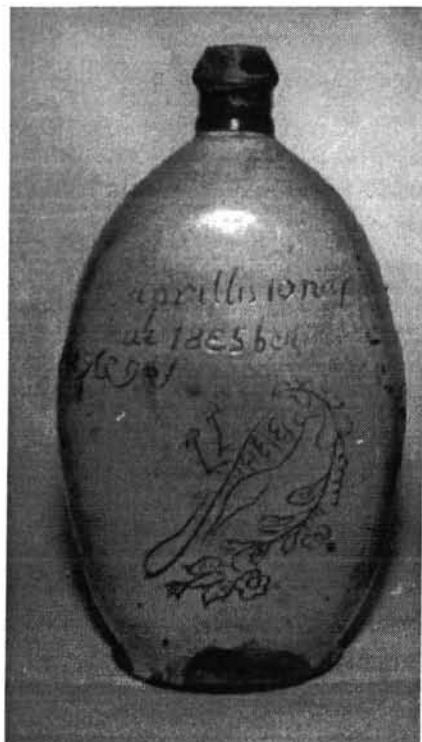
1. kép. 1835-ös butella madaras előlapja