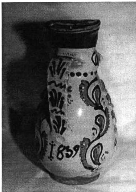
7. kép. 1839-es miskakancsó háta (NM 129626)