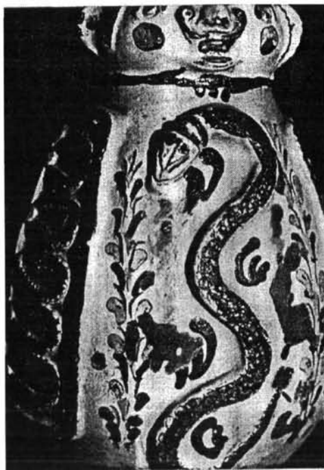
6. kép. A miskakancsó eleje

motívum a Néprajzi Múzeum 1839-es miskakancsóján ismétlődik meg. 20 A másik oldalon karcolt indasorban virág- és levéldíszek, melyek egyes elemei már kissé jobb rajzolatban a Herman Ottó Múzeum 1838-as, szerkesztett díszítményű mezőcsáti miskakancsóján köszönnek vissza. 21 Hasán kúpos gombsor fut végig, két oldalán karcolt rozmaringággal. Csákója barna, pereme zöld, a csákó alján, az orr fölött plasztikus, sárgára színezett rátétes gomb.