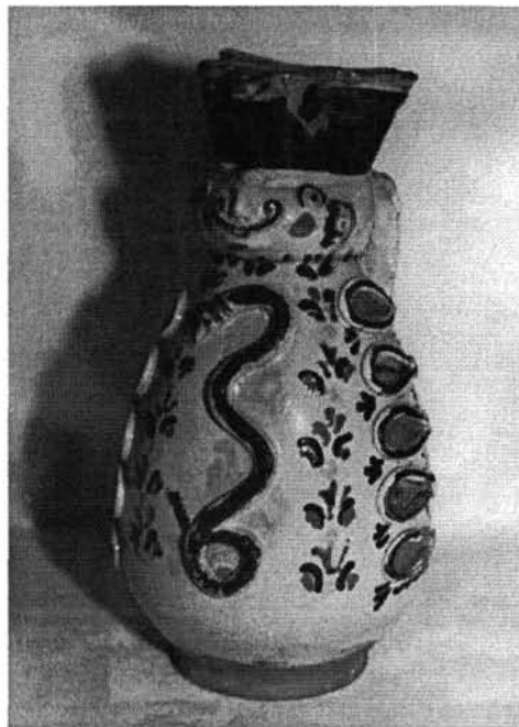
8. kép. A miskakancsó írókás díszítésű háta

Az 1839-es miskakancsón az ornamentika már teljesen letisztult. Füle két oldalán ívelt barna ágon karéjos levelek díszlenek. A kígyó két oldalán stilizált virágsorrrá rendeződnek a barna, zöld, vörös és sárga színezésű ívelt vonalak, melyek a reformkori mezőcsáti és füredi munkákon egyaránt előfordulnak (7–8. kép).