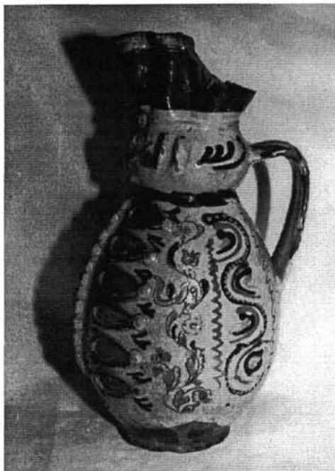
3. kép. 1835-ös miskakancsó virágdíszes oldala (NM 55.47.1.)