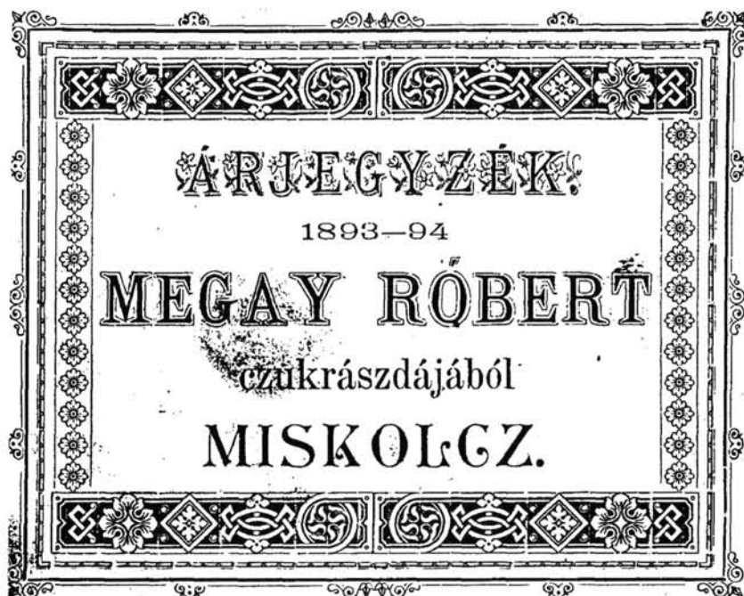
2. kép. A cukrászda „világszínvonalú” árlapja, 1893–1894.

ményeket, a téli időszakban is fagyaltokat, a „nyalánkságok” között tiroli „candirozott” gyümölcsöt, karamellirozott gesztenyét, gesztenyepürét és gyümölcsöt kínált. Az árlap felsorol háromféle pezsgőt, hatféle likórt, háromféle konyakot, háromféle rumot. A hatféle teához ugyanennyifajta teasüteményt kínál. A borok és bonbonok mellett „újdonságok” sokaságát is megtaláljuk az árjegyzékben (2. kép).