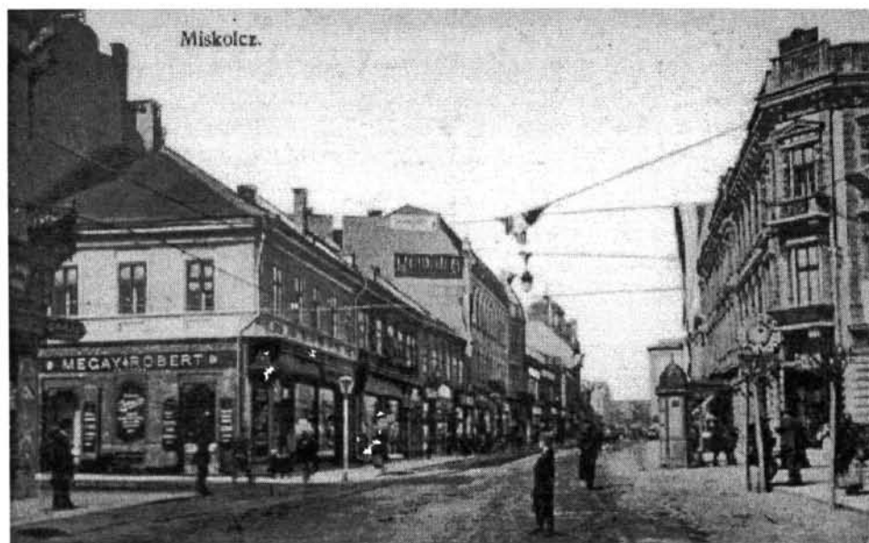
9. kép. A „Megay-sarok”-nak egykor nevet adó cukrászda, 1913 k.