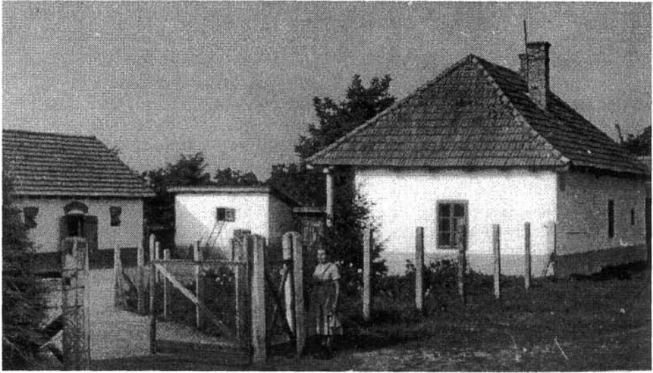
1. kép. Az 1969-ben lebontott 1/5-ös tiszacsegei gátórház