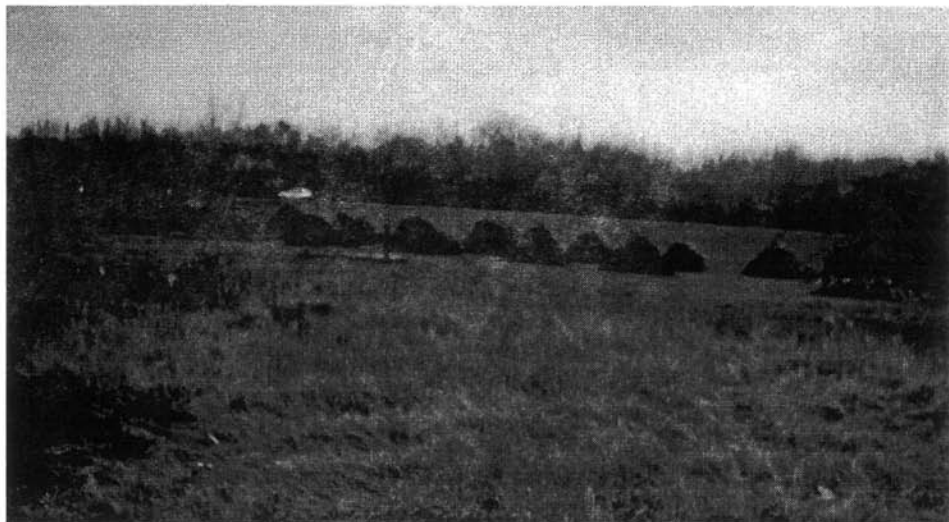
2. kép. Rőzsekazlak Tiszabábolmán 1997-ben

Hogy a tőke fiatal hajtásokat hozzon, tervszerűen kellett csonkátatni. Ezt a gátörnek pontosan kellett tudnia, mert ha nem volt tisztában azzal, hogy mennyi rőzsére van szüksége a járásban, bizony könnyen útilaput köthettek a talpára.” 22