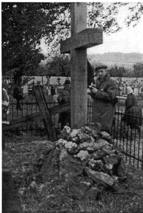
Szinyei Merse Pál régi és új sírkeresztje Jernyén, 1995-ben

Szinyei szelleme megérintette az egybegyűlteket, a két nap alatt többször érezhetjük úgy, a művész hagyatékának valódi örökösei vagyunk.