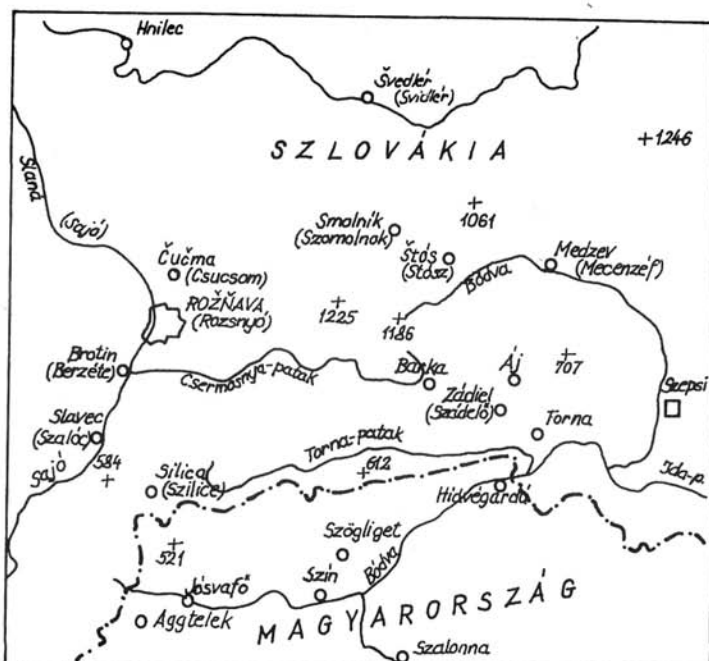
1. térkép. A gömör-tornai karsztvidék és környezete

században a tornagörgői királyi udvartartás ellátását biztosította. (Győrffy György 1987 3 I. 45.) A tornai várispánságból már a tatárjárás előtt megindult a kitelepülés a Szepesség irányába. Ezzel előbb kiterjesztették Torna területét a későbbi Szepes vármegye déli részeire. (Székely György 1984. 320.) Önállósult királyi vármegyeként azonban elvesztette a korábban az erdőispánsághoz tartozó gömöri, szepesi, abaúji területeit (Pelsőc, Csetnek, Tapolca, Szepesolaszi, Jászó). A tornai erdőispánság területe tehát jóval terjedelmesebb volt, mint a későbbi Torna vármegye. A Borsod határán, gyepűvidékén létesült tornai ispánság Szepes vármegye megszervezése, leválása előtt egészen a Tátráig, a Kárpátokig ért. (Győrffy György 1987 3 . 740.) A 14. század elején aztán átalakult a királyi terület nemesi vármegyévé. Az erről tanúskodó első adat 1319-ből való, amikor Torna szolgabíráit említik.