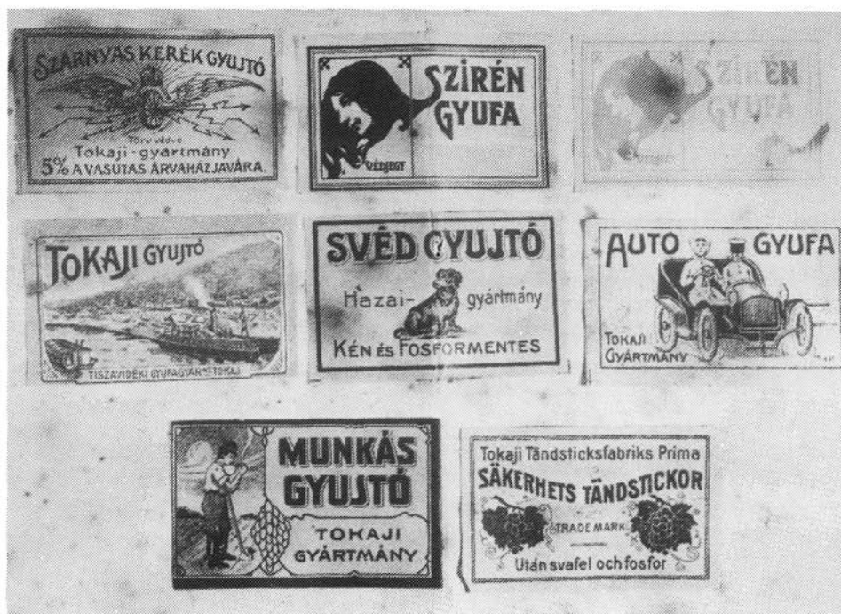
2. kép. A Tokaji Gyufagyár gyufacímkei