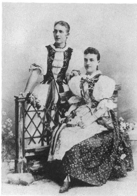
7. kép. Herman Ottónak korteskedő lányok

1893. október 24.: Arra, hogy én föl akarom vetni nálatok a bizalmi kérdést , azt mondta (itt Kossuthról van szó – a szerző), hogy ezt sajnálná, mert én alapjában