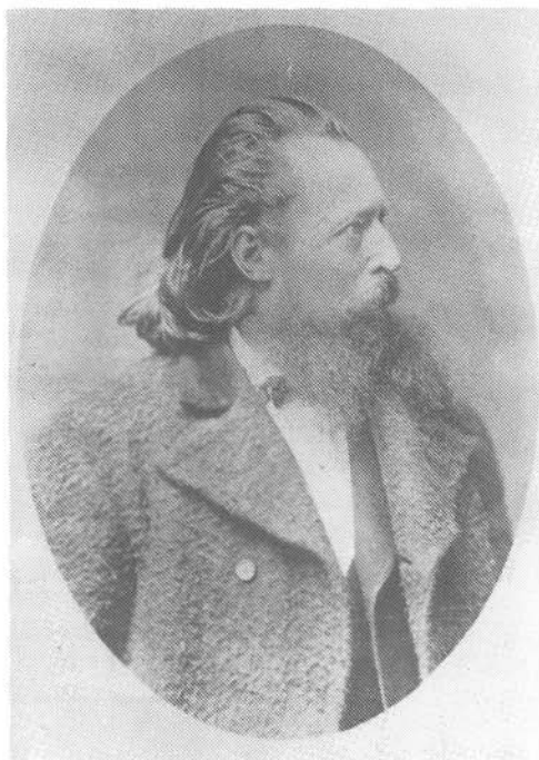
5. kép. Herman Ottó, a radikális függetlenségi képviselő