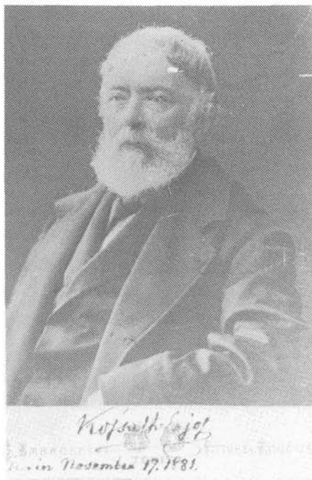
4. kép. A „szent öreg” portréja

Firenze „milliókat erő szobrainak” káprázata után, november 24-én érkeztek meg Rómába. „Elértünk hát utazásunk