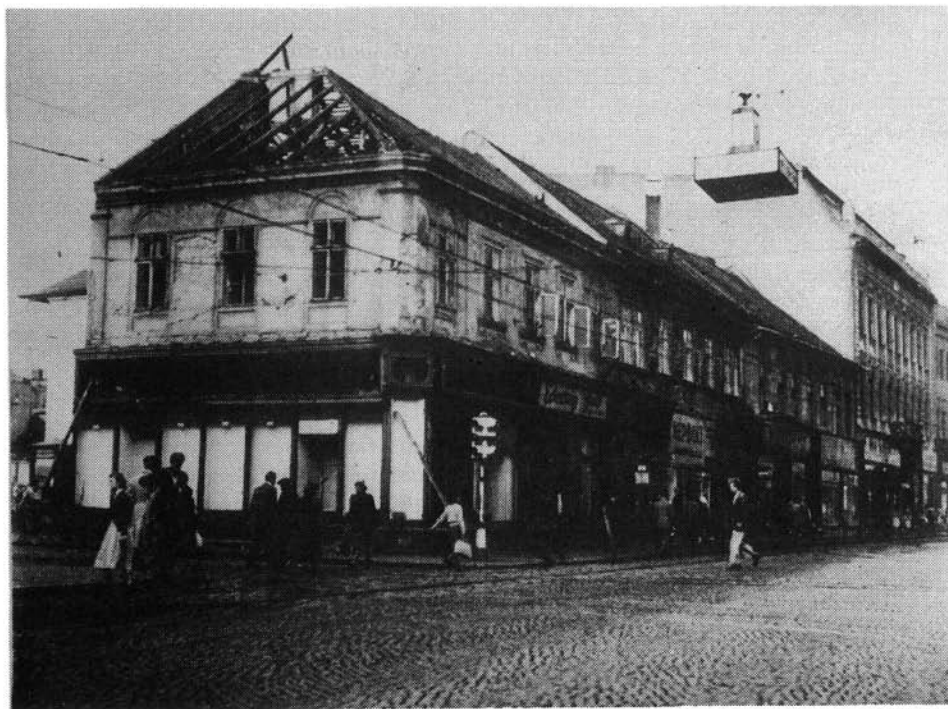
10. kép. Az egykori Megay cukrászda épülete, bontás előtt 1955-ben