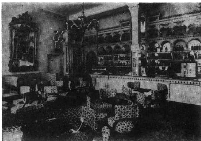
13. kép. A Doró cukrászda belseje 1934-ben