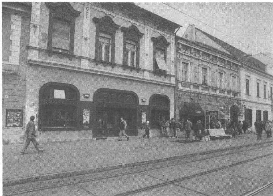
14. kép. A Rác kávéház 1992-ben