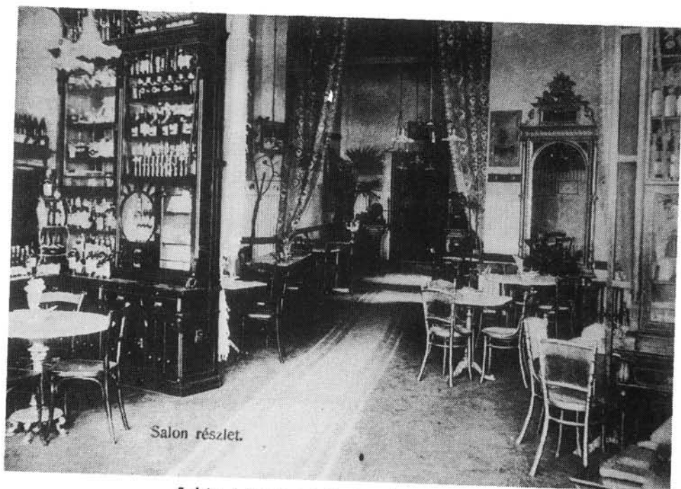
5. kép. A Megay cukrászda szalonja 1910 körül