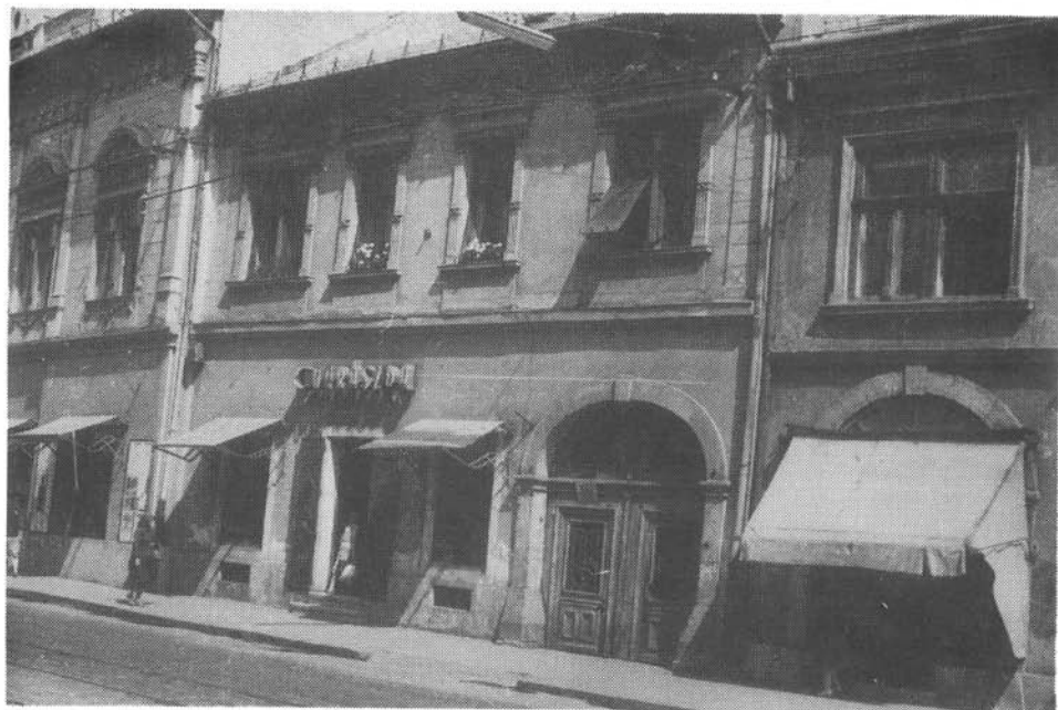
3. kép. A Rorárius cukrászda, a Széchenyi u. 5. szám alatt, 1961-ben