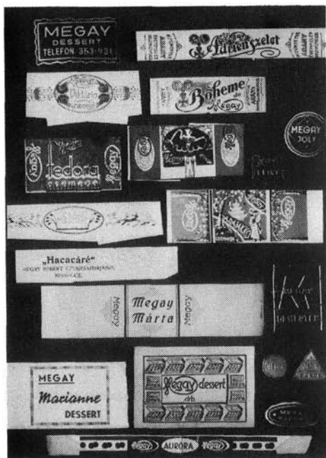
8. kép. Megay cukrászműhelyének termékféleségei, I.