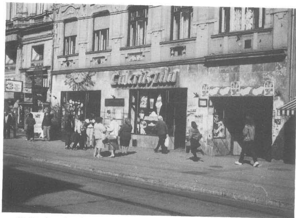
12. kép. Az egykori Piva, későbbi Napsugár cukrászda 1992-ben Bigaton-érdekeltégű