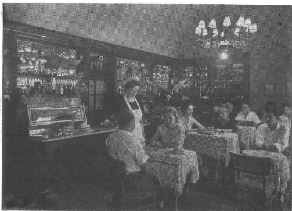
2. kép. A Rorárius cukrászda berendezése az épület bontása előtt