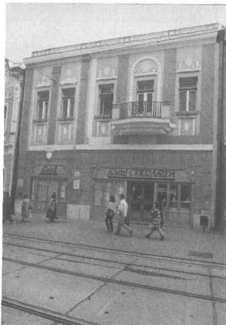
15. kép. A Capri cukrászda felújított épülete 1992-ben