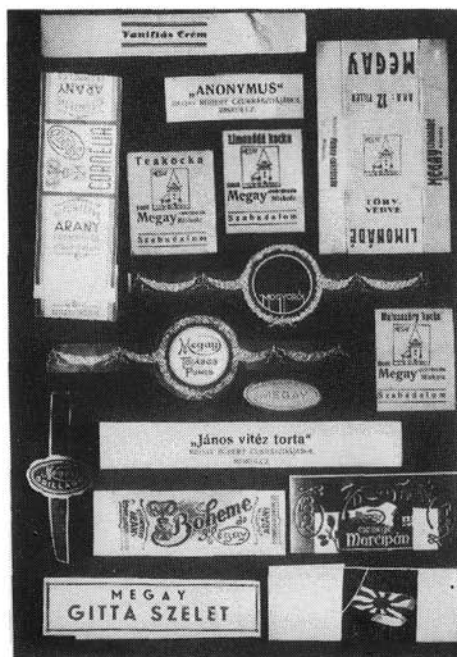
9. kép. Megay cukrászműhelyének termékféleségei, II.