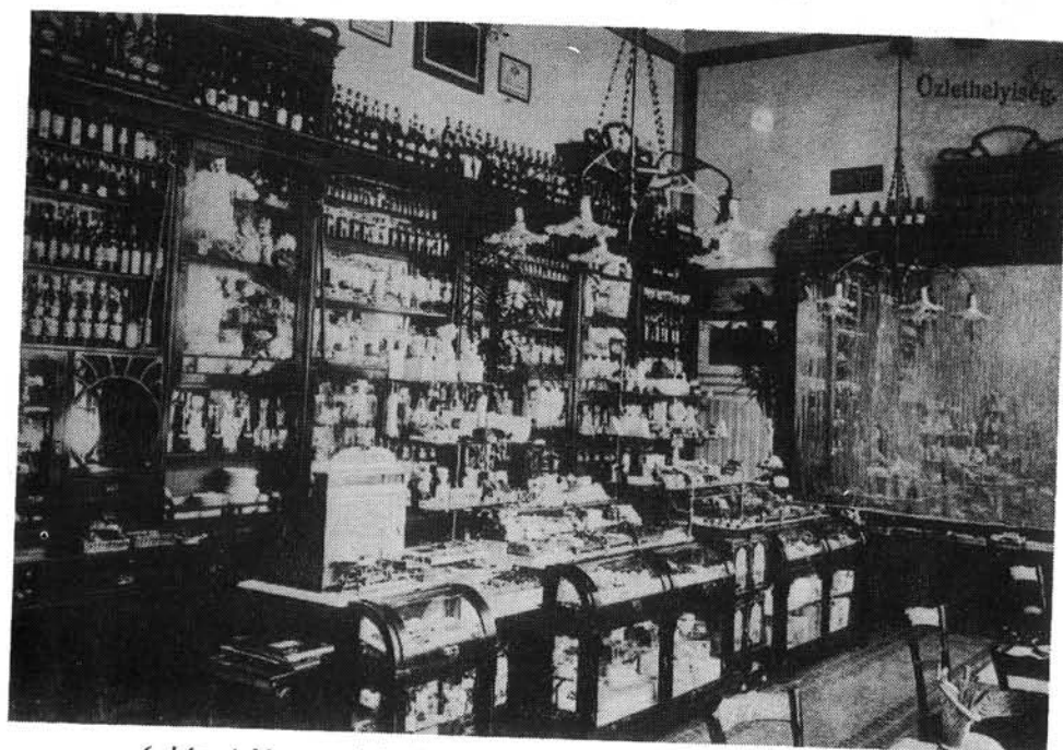
6. kép. A Megay cukrászda üzlethelyisége, belső berendezése 1910 körül