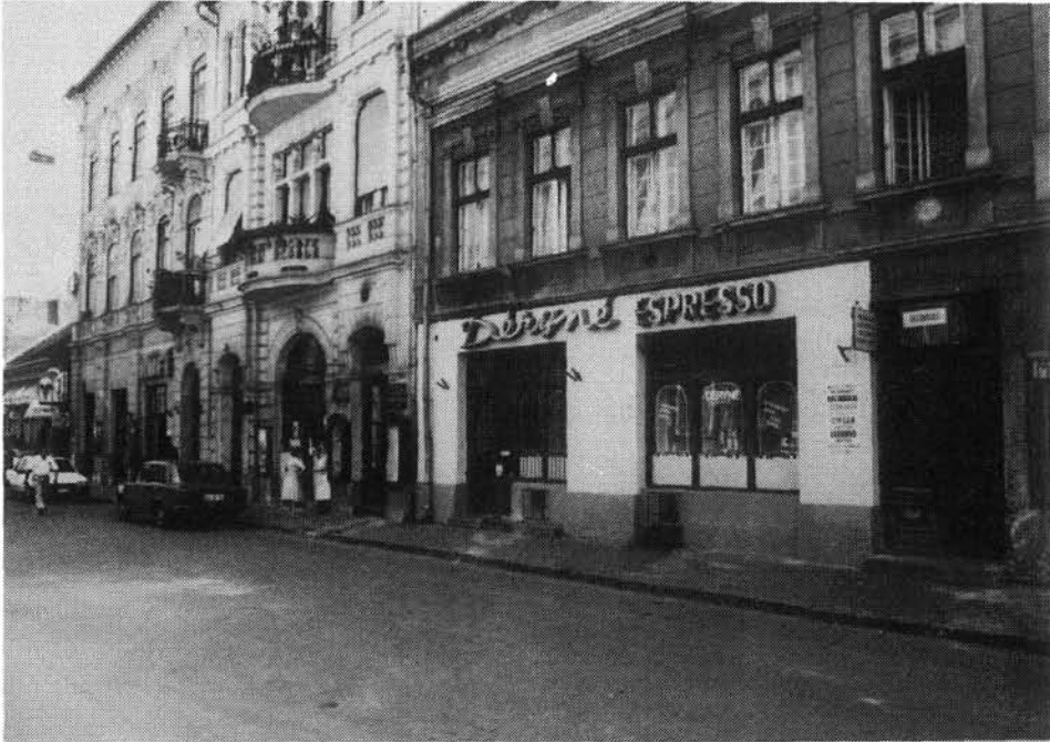
17. kép. A Déryné eszpresszó a Déryné u. 2. szám alatt 1992-ben

hagyományosan a cukrászműhelyek voltak). 71 A gyár két alkalmazottal még 1949-ben dolgozott, s a vendéglátóipari egységek államosításakor, 1951-ben vagy 1952-ben megszűnt.