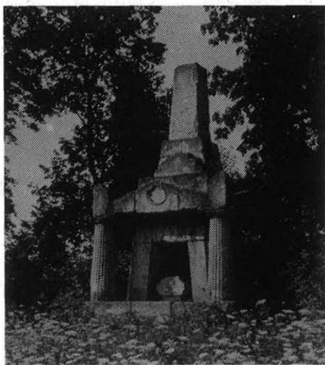
4. kép. A „titokzatos” síremlék

adója, hűséges segítője lesz. A labancok olyan veszedelmes ellenfélnek tartják, hogy gúnydalt írnak ellene. Egy hatalmas kuruc költemény: Thököly haditanácsa pedig 40 versszakban mondja el Szepessy Pál „voxát”, beszédét, ilyen szavakat adva szájába: