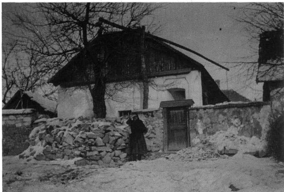
5. kép. A régi sályi református parókia, ahova Eötvös ellátogatott (1964)