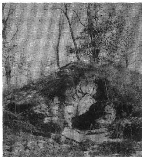
3. kép. Barlangház maradványai