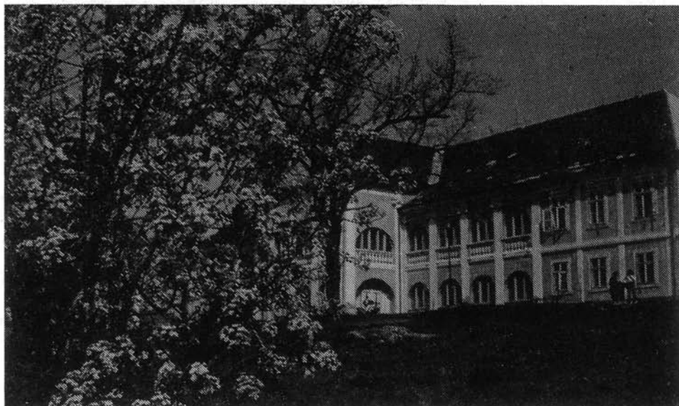
1. kép. A helyreállított sályi Eötvös-kastély (1970)

A Szepessy család évszázadok óta fontos szerepet töltött be az ország életében. Gyakran találjuk nevüket országgyűlések jegyzőkönyveiben. 11 Kitüntetik magukat a török elleni harcokban. Szepessy Pál Borsod megye alispánja, a megye országgyűlési követe. Később a kora kurucmozgalmak jelentős alakja. Még csatát is nyer. Szinánál megveri Spankau császári tábornok seregét. Thököly Imrének egyik főembere, tanács-