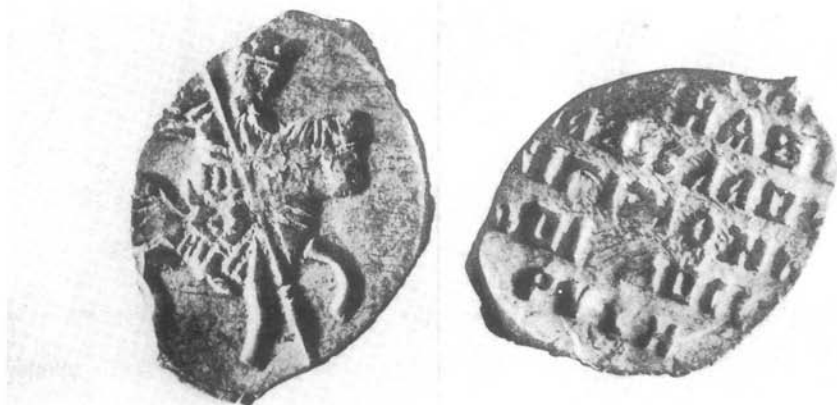
3. kép. Wladyslaw Sigismund királyfi, kopejka 1610