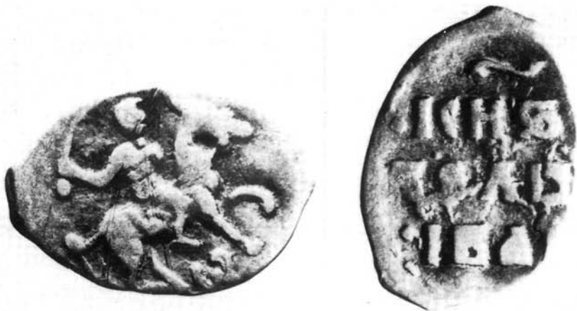
1. kép. IV. (Rettegett) Iván: Gyenga 1547 előtt

1613 után hamarosan újra kezdik a gyenga és a poluska előállítását, amely azonban nagyon korlátozott jellegű, 7 ezen pénztermék forgalmáról főleg a távoli településeken, nincsenek adataink. 8