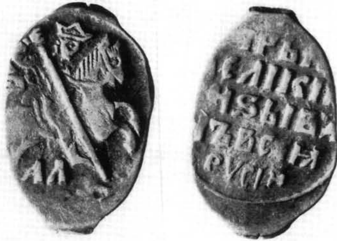
2. kép. IV. (Rettegett) Iván: Kopejka 1547 után

volt a kicsi piaci forgalom ellátására,” de ennek ellenére ez a forgalom is „gyakorlatilag” csak a kopejkával történt. 13