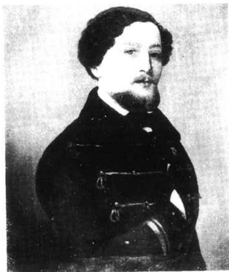
6. kép. Simonyi Antal: Rabportré, 1852. (Hadtörténeti Múzeum)

Miskolcon őrzött rabképe és az Önarcképe méretazonossága esetleg fölveheti halványan az azonos időben, 1851/52-ben való készülés lehetőségét. Mindenesetre az Önarckép jól összevethető Marastoni József Simonyiról később, 1864-ben készült litográfia-arcképével. Az Önarckép festett, szürke, ovális keretben, középen kissé világosodó háttér előtt oldalvlasztott barna hajú és szakállú férfi mellképe. A test, a váll vonala elfordul kissé, de az arc teljes szembenézetben, frontálisan mutatkozik meg. Magasan záródó, kétsorosán gombolt kabátja gallérjára fehér ing hajlik ki. A világító inggallér kiemeli a barna szakáll keretezte, elgondolkodó-értelmes, ugyanakkor elszánt és határozott, világos arcot. A portréről egyfajta biztonság, magabiztosság árad, talán keménység is párosul rajta az őszinte szembenézés, az önfeltárás-önmegmérics igényével, a pontos lélektani jellemzéssel.