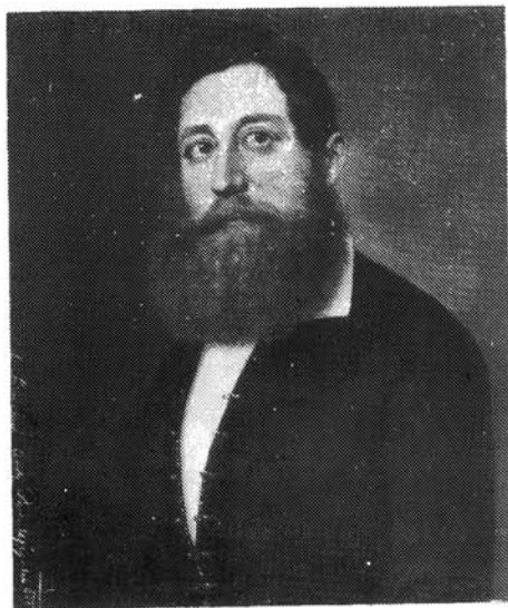
5. kép. Simonyi Antal: Dombrády László arcképe, 1851 (HOM)