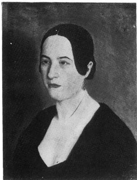
1. kép. Simonyi Antal: Női portré, 1845 (Katona József Múzeum)