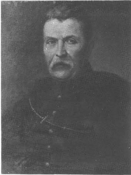
8. kép. Simonyi Antal: Szemere Pál arcképe, 1855 (Reprodukcióból ismert)