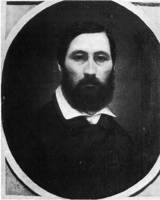
7. kép. Simonyi Antal: Önarckép 1852 k. (MNG)

Simonyi az önkényuralom egy egészen speciális arcképfajtájában, a börtönportréban alkotta a legmaradandóbb történeti értékű és művészettörténeti becsű műveit. Mivel a legismertebb rabsorozatokat műkedvelő festők (felsőszopori Tóth Ágoston, Berzsényi Lénárt stb.) készítették, így ezek sorából művészi színvonalukkal eleve kiemelkednek a képzett festő alkotásai. Simonyi 1851 októberében, az Újépületben megfestette egyik rabtársának, a Garibaldival az itáliai szabadságharcért harcoló