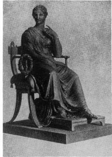
4. kép. Canova: Elisa Bonaparte – Polyhymnia. 1812–17. Bécs, Kunsthistorisches Museum

Ezek után következnek három katolikus iskolaváros: