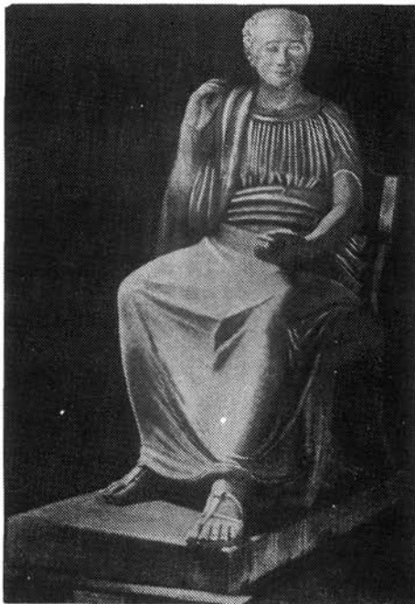
5. kép. Ferenczy István: Kölcsey Ferenc. 1839–41. Budapest, Magyar Nemzeti Galéria

Szemere Bertalan közben tovább folytatta a gyűjtést az árnyékba szorulva, kevés eredménnyel. „Amália” barátnőitől 11 kézimunka gyűlt össze, a Kaszinó pénztárába befolyt 100 pengő forint. 10 Ezt a Kisfaludy Társaságon kívül álló Deák Ferenchez juttatták el. 1840 márciusában Szemere gyűlölködő cikket írt Fáy és Toldy ellen: kit illet a kezdeményezés dicsősége? Egyetlen tekintélyes lap sem volt hajlandó leközölni, végül