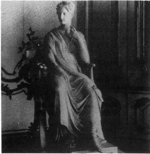
3. kép. Canova: Elisa Bonaparte – Polyhymnia. 1812–17. Bécs, Kunsthistorisches Museum