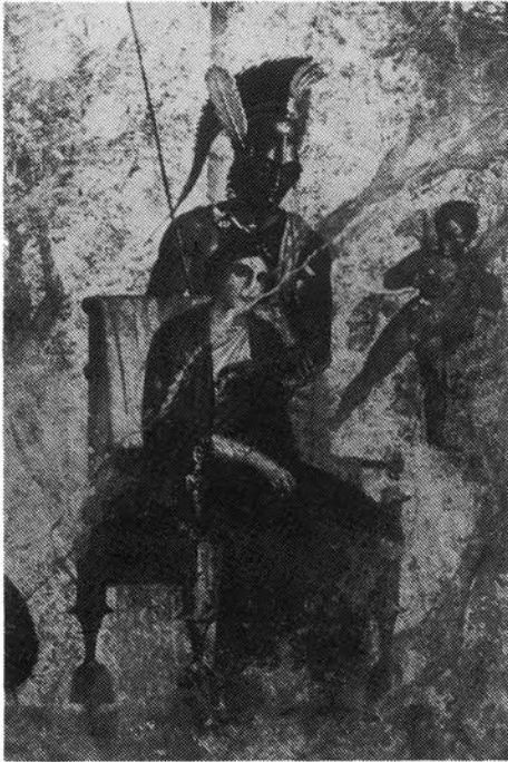
1. kép. Venus és Mars. Falkép Pompeiben. I. u. I. sz.