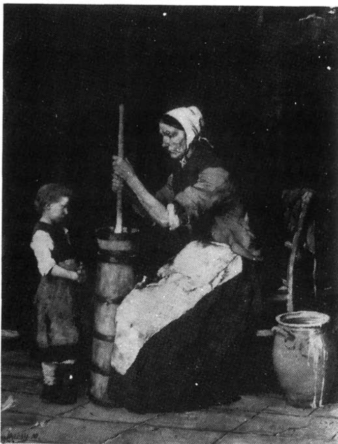
4. kép. Munkácsy Mihály: Köptető asszony Magyar Nemzeti Galéria

melynek elégikus témáját Szapolyai János, utolsó nemzeti királyunk özvegyének életéből vette. Izabella mielőtt elhagyja Erdélyt, hogy Lengyelországban, szüleinél, I. Zsigmond lengyel királynál keressen menedéket, még egyszer végigtekint a szeretett tájon. 17 A festményt fojtott érzelem, tartózkodó színvilág jellemzi. A búcsú fájdalmát nyugodt kompozícióban, borongós tájképben, a müncheni iskola romantikus akadémikus stílusában fogalmazta meg. A részletek igen gondos megmunkálása, a lokálszínek mesteri alkalmazása mellett a táj kidolgozása arra utal, hogy Wagner a természetben is készített stúdiumokat. A kiállításon szereplő másik műve Ligeti Antallal közös munkája Vajda-Hunyad vára , melyben a Hunyadiak ősi fészket ábrázolták Mátyás vadászatáról való visszatérésének jelenetével. A romantikus tájábrázolás Ligeti Antal, az alakok megfestése Wagner Sándor munkája. 18