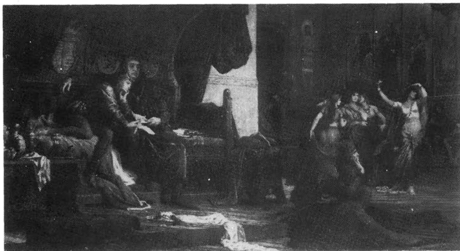
5. kép. Székely Bertalan: V. László és Czillei Magyar Nemzeti Galéria