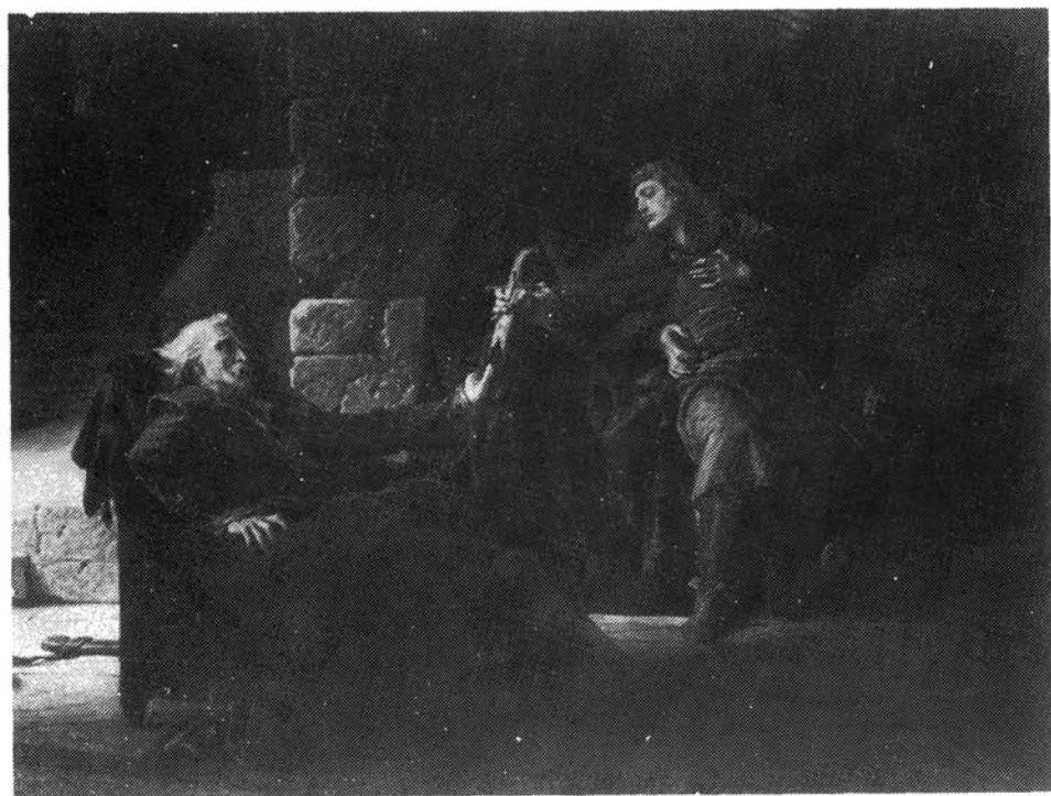
6. kép. Székely Bertalan: Thököly Imre menekülése Magyar Nemzeti Galéria