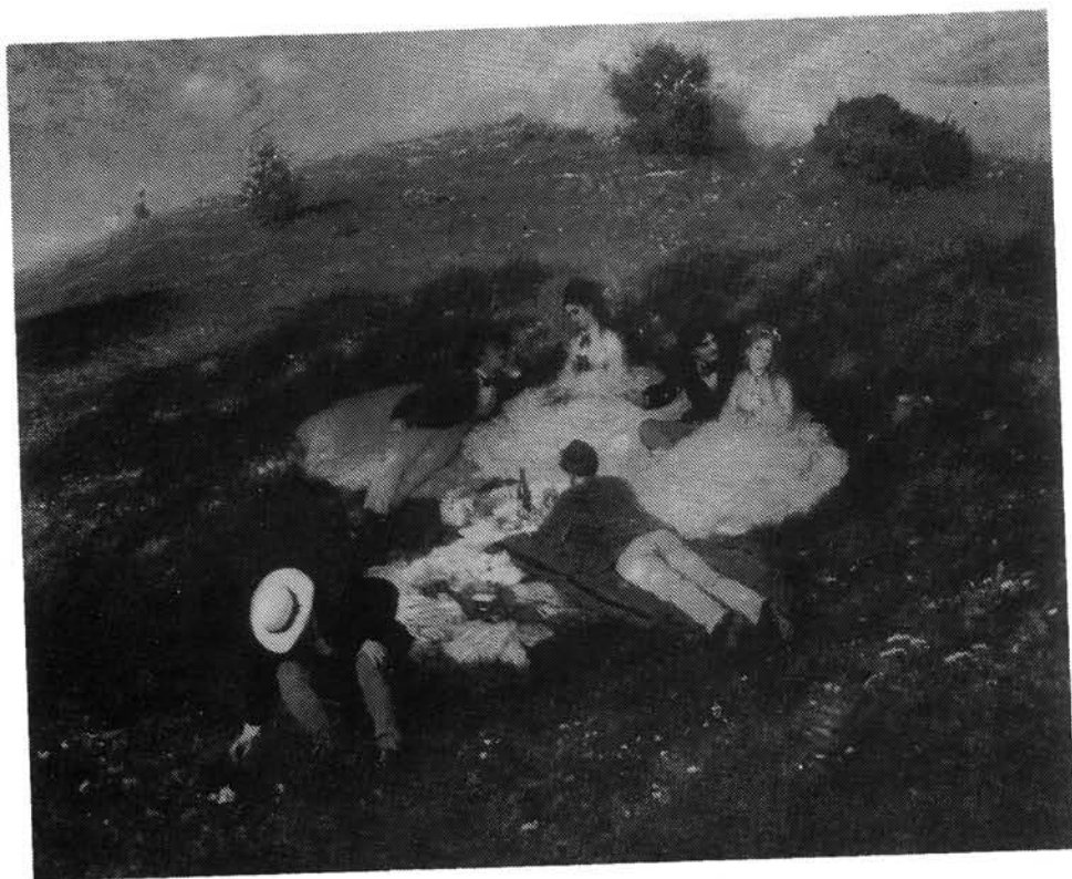
8. kép. Szinyei Merse Pál: Majális Magyar Nemzeti Galéria

szívesen hangsúlyozta a természet pontos és aprólékos megfigyelésének követését, festészetében maga is a táj hű ábrázolására, részletes kidolgozására törekedett a bécsi és a müncheni iskolák felfogásában. Erdős vidék című festményét művészeti éremmel tüntették ki.