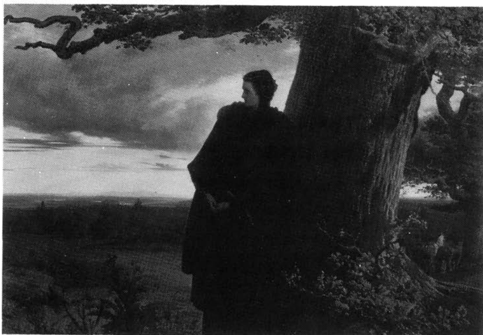
7. kép. Wagner Sándor: Izabella királyné búcsúja Erdélytől Magyar Nemzeti Galéria

jelenítette meg. Történelmi kompozíciója témáját Bethlen Gábor tudósai között , a XVII. századból, Erdély virágkorából vette. 21