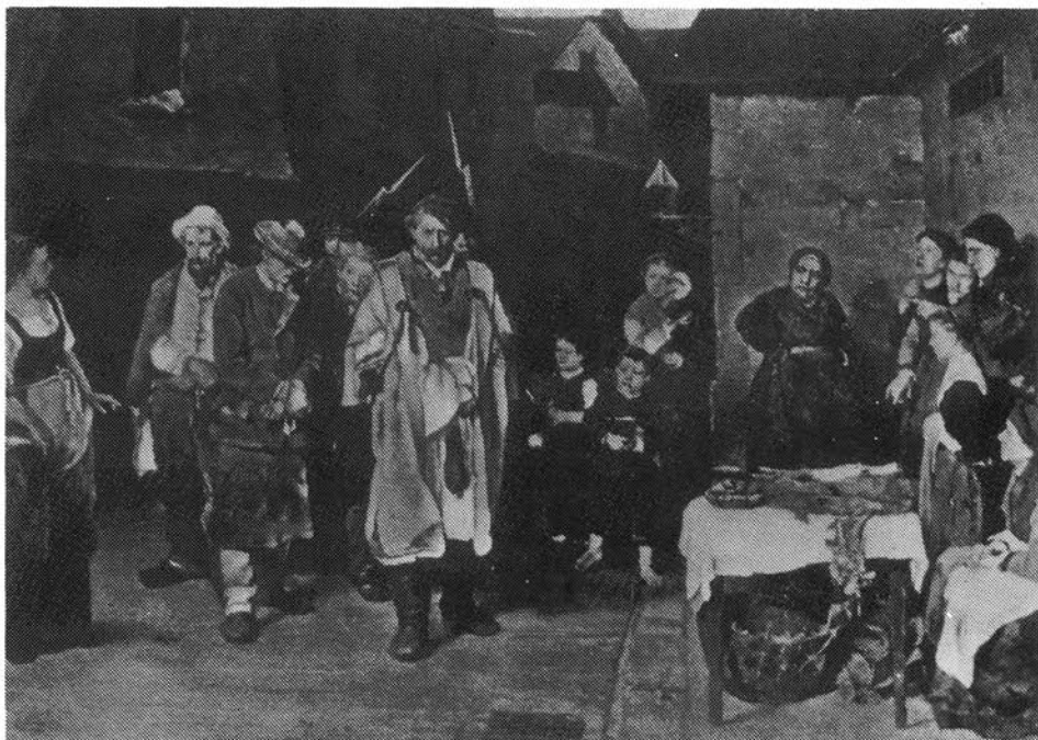
2. kép. Munkácsy Mihály: Éjjeli csavargók Magyar Nemzeti Galéria

varázsából találunk ebben az erős, férfias festésben . . . Ezek az Éjjeli csavargók úgy tűnnek, mintha az Éjjeli őrzőjárat fantasztikus környezetében mozognának . . . 13