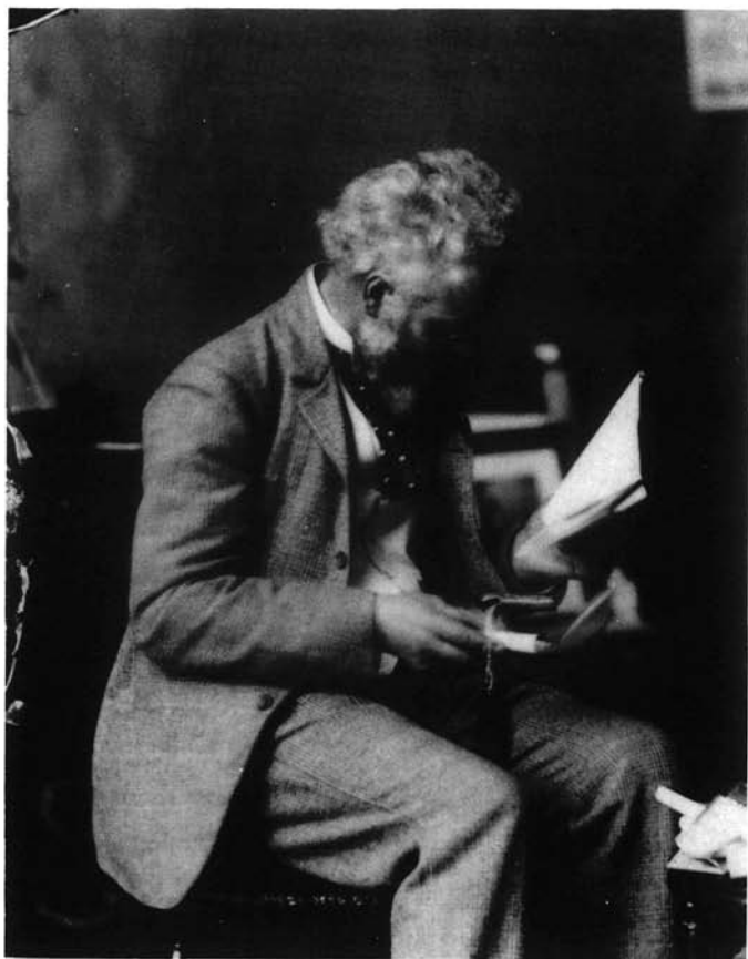
3. kép. Schabinszky László: Munkácsy Mihály Miskolcon, 1891-ben