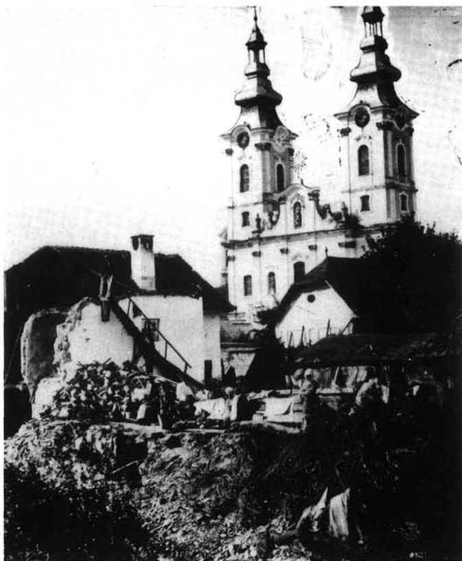
5. kép. Szinay István: Árvíz Miskolcon (a Vereshíd utca), 1878