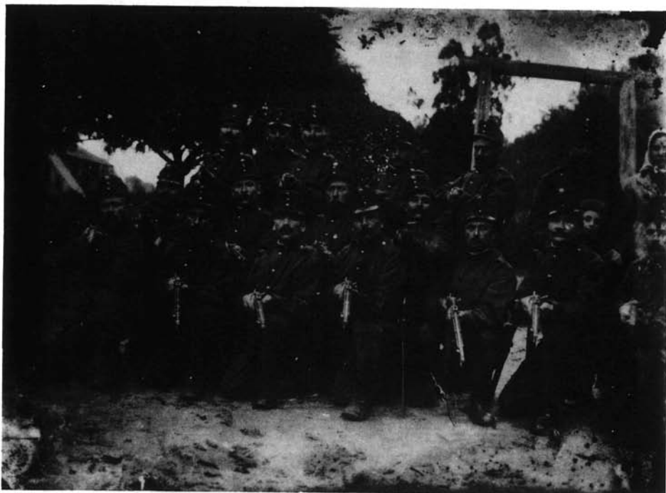
8. kép. Ismeretlen: Katonák Miskolcon az első világháborúban