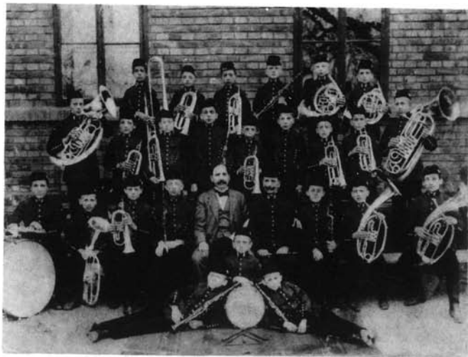
7. kép. Ismeretlen: A percesi „Bányamécs” zenekar 1911-ben