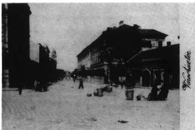
6. kép. Schabinszky László: A Városház tér 1890 körül