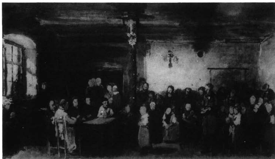
7. kép. Colpachi iskola. Restaurált mű (Olaj, vászon, 124x207 cm; Jelzve jobbra lent: M d Munkácsy; [MNG Ltsz: 76.20 T])