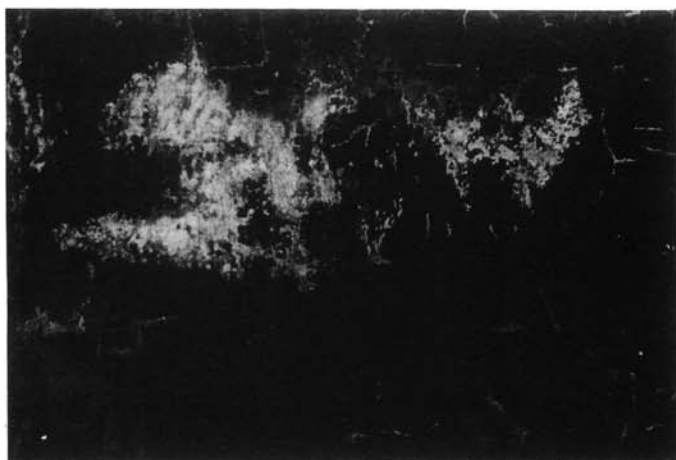
2. kép. Colpachi iskola. Részben tömített állapot (részlet)

gyűrődéssel és lepergett festékréteggel került a Nemzeti Galéria restaurátor-műhelyébe, ahol Moldován Angéla restaurátor végezte el a helyreállítási teendőket. Az első tennivaló a kalandos úton megkerült mű életmentő konzerválása volt: ez a művelet vákuumos présasztalban történt. A fölmelegítés többszöri megismétlésére volt szükség, mivel a törésvonalak és gyűrődések makacsul megmaradtak. Azután, hogy az egész felület egyenletesen kisimult, következhetett az új vászonra húzás, mert az idők során