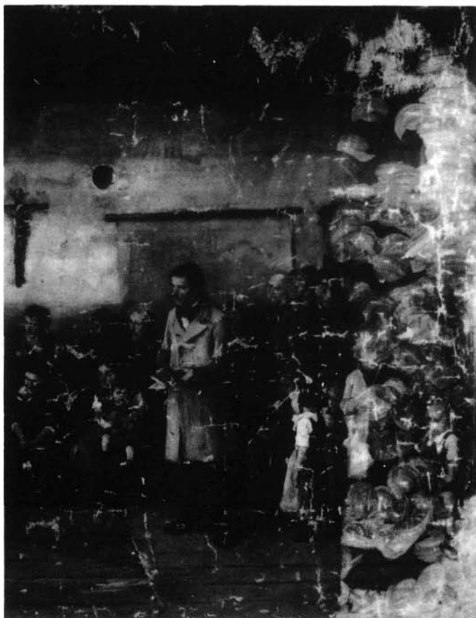
6. kép. Colpachi iskola. Teljesen tömített állapot (részlet)

A restaurátori munka legkényesebb fázisára került ezután a sor: a képfelület folytonossági hiányainak megszüntetése következett (3. kép). Rengeteg kitöredezés és nagymérvű festékhány jellemezte a festményt, a gombostűfejnyi nagyságtól egészen a többtenyérnyi egybefüggő hiányosságig. Az egész felületen alig volt intakt terület. Szerencsére a nagy és egybefüggő festékhányok főleg a háttérre korlátozódtak (4. és 5. kép).