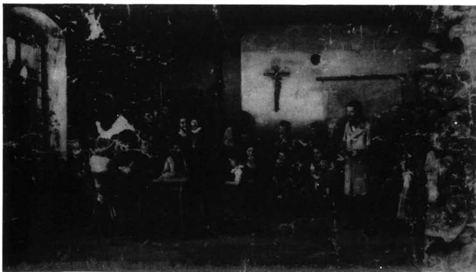
8. kép. Colpachi iskola, vázlat. Colpach, 1875. (Olaj, vászon, 62,7x109,6 cm; Jelzés nélkül [MN Ltsz: 3927])