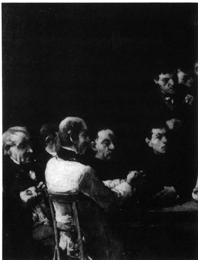
5. kép. Colpachi iskola. Restaurált mű (részlet)

meggyöngült vászonnak már nem lett volna tartóereje és rongyos széle sem bírta volna ki a felfeszítést. A festmény – a megerősítő újravásznazás után – új feszítőkeretre került. Ezt követően lehetett alávetni komolyabb vizsgálatoknak, mert az eredeti állapotban minden fölösleges mozzgatás a még meglévő festékréteg lepergését okozhatta volna. Miután ez a veszély elhárult, még a tisztítási művelet elvégzése előtt, mikroszkópos vizsgálatra került sor. A mű állapotából arra lehetett következtetni, hogy korábban nem érte semmiféle restaurátori beavatkozás. Egyúttal föltárult a háttérben jobb oldalt, gyöngén szabad szemmel is látható kompozíciós változtatás: Munkácsy csak vékony lazúrréteggel fedte le korábbi elképzelését (2. kép). Rendkívüli szerencsének mondható, hogy ezt a művét nem aszfalttal alapozta. Így a művész eredeti elképzelését semmiféle maradandó színváltozás nem torzította el az idők folyamán. A színeket és az esztétikai hatást viszont erősen befolyásolta a festményt fedő, megsárgult, de viszonylag könnyen oldható firniszréteg, valamint az idők során rárakódott piszok. Ezek eltávolítása után eredeti szépségükben ragyogtak fel a művészre oly jellemző kék, vörös és fehér színek. A festékréteg is jó állapotban maradt. Nem repedezett meg úgy, ahogy az aszfalttal alapozott képeken szokott.