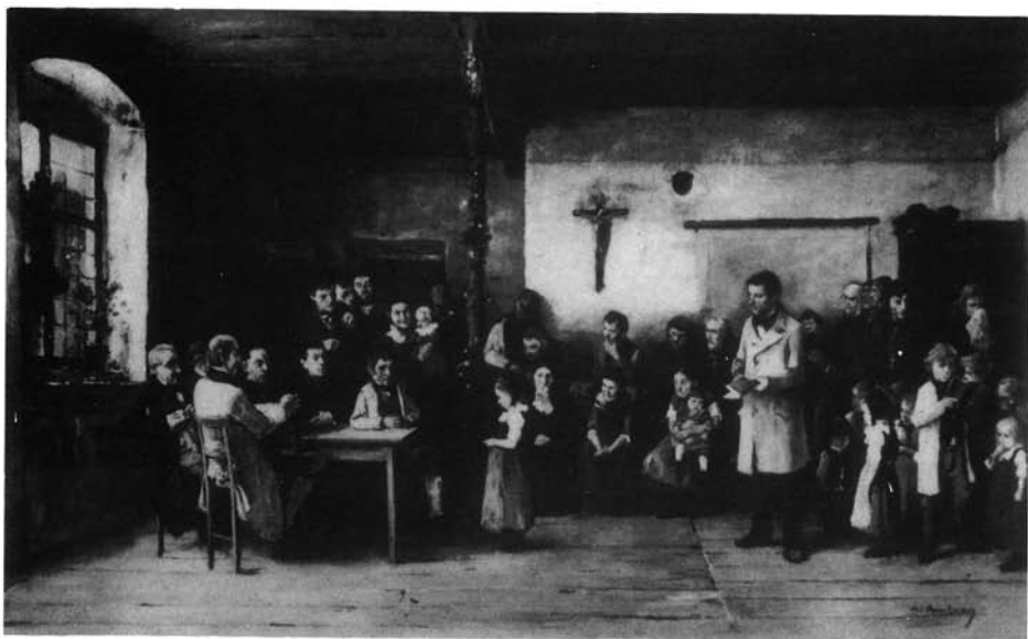
3. kép. Colpachi iskola. Részben tömített állapot