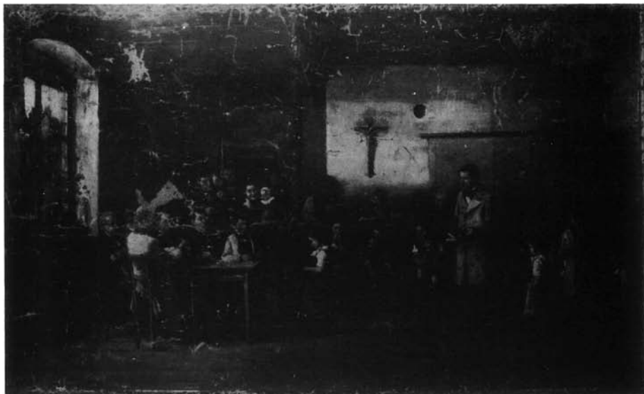
1. kép. Colpachi iskola, Párizs, 1882. Eredeti, restaurálás előtti állapot. (Olaj, vászon, 124x207 cm. Jelezve jobbra lent: M d Munkácsy; [MNG Ltsz: 76.20 T])

gyűrődéssel és lepergett festékréteggel került a Nemzeti Galéria restaurátor-műhelyébe, ahol Moldován Angéla restaurátor végezte el a helyreállítási teendőket. Az első tennivaló a kalandos úton megkerült mű életmentő konzerválása volt: ez a művelet vákuumos présasztalban történt. A fölmelegítés többszöri megismétlésére volt szükség, mivel a törésvonalak és gyűrődések makacsul megmaradtak. Azután, hogy az egész felület egyenletesen kisimult, következhetett az új vászonra húzás, mert az idők során