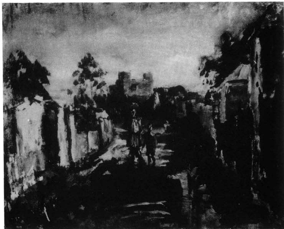
22. kép. Délután a vár (karton, olaj, 59x74 cm Ltsz: SK. 70.129.)

lásával akaratlanul is többet mond egy romantikus művésznél, s a gesztusokat őrző előadasmódja egyben a művész állásfoglalását hordozza. A cigányság zárt közösségét csak a negyedik rend világában otthonosan forgó művész volt képes ilyen hitellel megközelíteni.