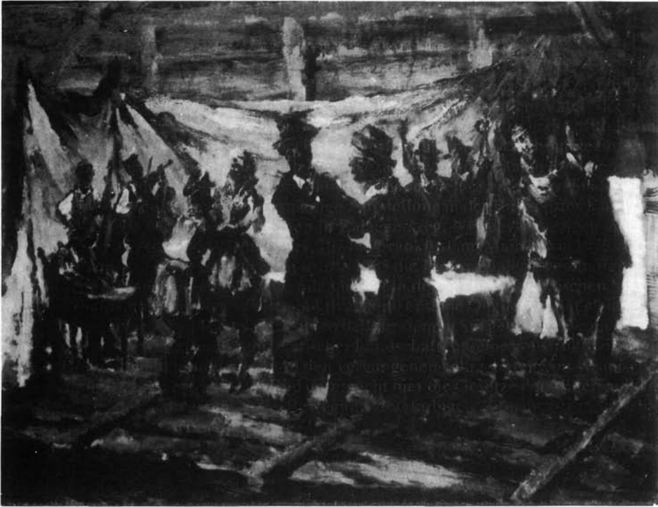
20. kép. A fővárosi színjátszó társulat előadása Árkuson (Hortobágy) „Tegnap asszony, ma menyasszony”, 1961. (funér, olaj, 100x125 mm Ltsz: SK. 70.90.)

tők közvetítésével, asztal köré rendezi el Holló a mulatozókat alakító színészeket. A táncoló párok a falusi típusokat elevenítik meg: a susztertáncot járó vasutas magát mulattatva forgatja a „falu szépét”, a sötét ünneplőt öltő gazdaember odaadóan ropja a csárdást az elhanyagolt asszonysággal. Az ital mámorától kurjongató vőfélyek csoportja zárja az asztal köré rendezett kompozíciót. A színpadiasság ezúttal maga a valóság, melyre csak néhány szegényes kulissza utal. A vándortársulat egyszerű díszlete az a vöröscserepes házeresz, amely a kép jobb felső részén segít a tér a térben élményt felkelteni, a pontos eligazodást szolgálni.