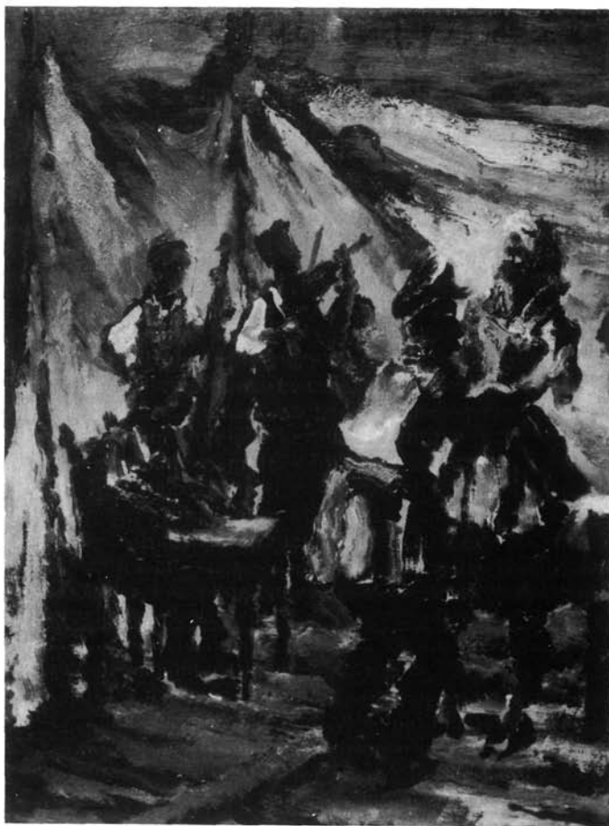
21. kép. A 20. számú kép részlete