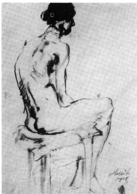
3. kép. Akttanulmány, 1928. (p. szénrajz, 300x235 mm Ltsz: HOM 86.39.)