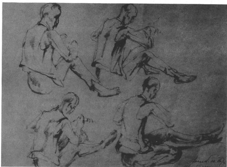
8. kép. Mozdulattanulmány, 1936. (ceruzarajz, 240x303 mm Ltsz: HOM 86.38.)