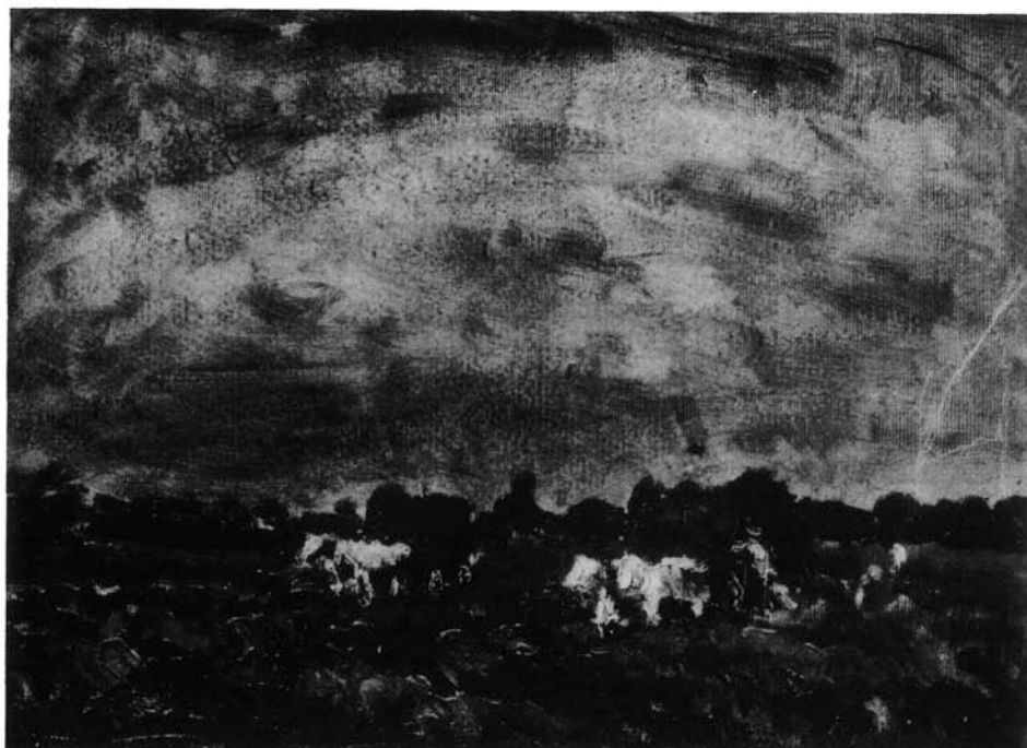
17. kép. Szénahordás, 1940. (p. olaj, 22,5x31 cm Ltsz: HOM P. 77.160.)

Az együtt haladó szénásszekerek elé befogott tehenek a színgazdag rét világos foltjait adják, melyek beépülnek a táj csendességébe. A munkálkodó emberek megfogalmazása sem részletező, s így a mező határozott egységet képez, s ellentétül szolgál az ég finom változásaira. A rét összes élőlényével, fákkal és emberekkel a zöldek, umbrák, pompeivörösek gazdag variációjából születnek meg, felhasználva a caput mortunt és az égetett-sziennát. A színek térérzékeltségével nagy távlatot képes visszaadni. A szerkező felrakott széna hol az alkonyi narancsok fényében jelenik meg, hol az erdőszél fainak türkizeivel kerül az előtérbe, hogy a harmadik dimenzió illúzióját keltsék. A járomba fogott tehének lassú haladása, egyben a kép nyugalmasságának hordozói, de az ecsetkezelés továbbra is Holló fűtöttségére utal. A tiszta színek és a palettán teremtett gazdag kolorizmus heves gesztussal, az önkifejezés feletti örömtől áthatva került az előkészítetlen, alapozatlan kartonlapra. A pillanatnyi hangulat sietős rögzítésére utal az a technikai hiányosság, ami a dr. Petró Sándor orvos gyűjteményéből múzeumunkba került festményét jellemzi. A kép jelzetlen, de kétségtelen, hogy Hollótól származó, s a hátoldalán található „Holló L. 1940.” felirat is ebben erősít meg bennünket.