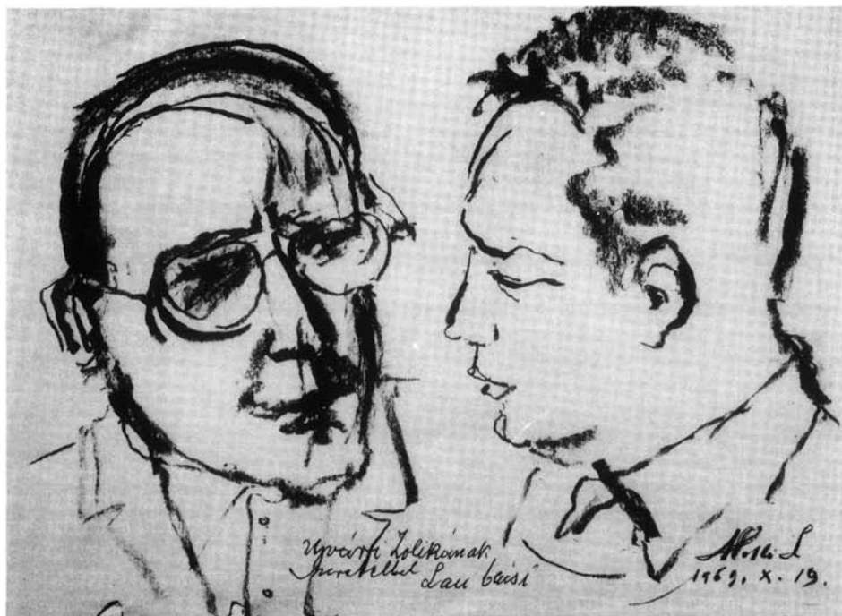
16. kép. Kettős portré, 1969. (p. szén, 210x216 mm Ltsz: HOM 86.40.)

emlegetett tónus új értelmet kap. Nem csupán a formát kiemelő eszköz már, hanem festői valór értékű az, ahogyan a kötényt, kendőt visszaadja az ekkorra már 80 éves mester.