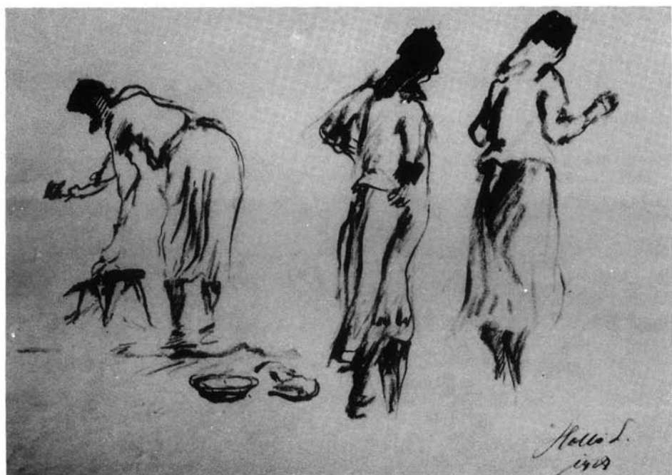
5. kép. Sulykoló asszony, 1928. (p. piittk., 235x300 mm Ltsz: HOM 86.35.)