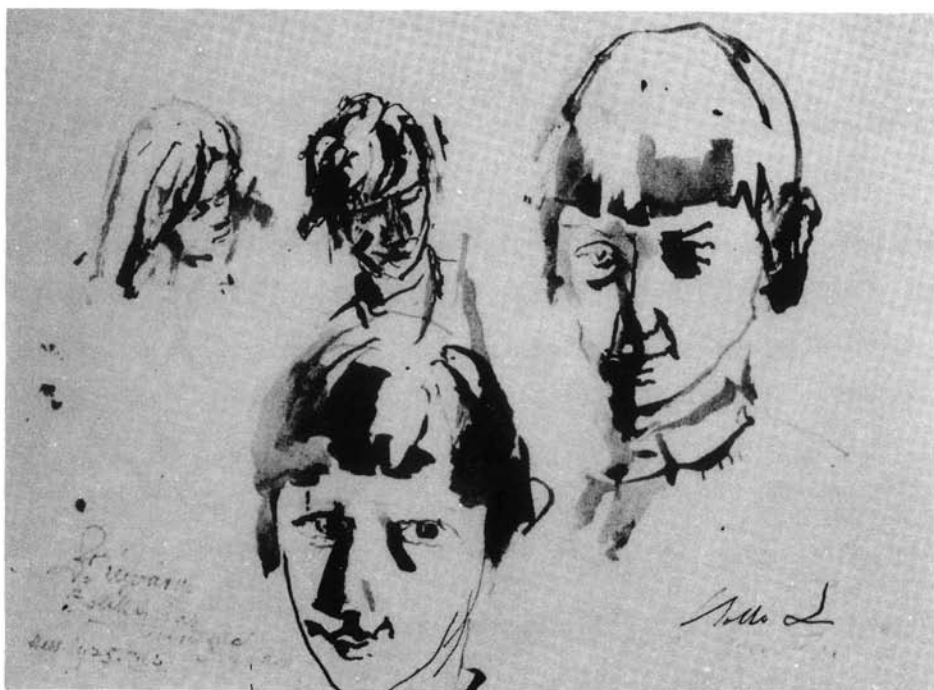
14. kép. Tanulmány, 1969. (p. lav. tus, 250x325 mm Ltsz: HOM 86.32.)