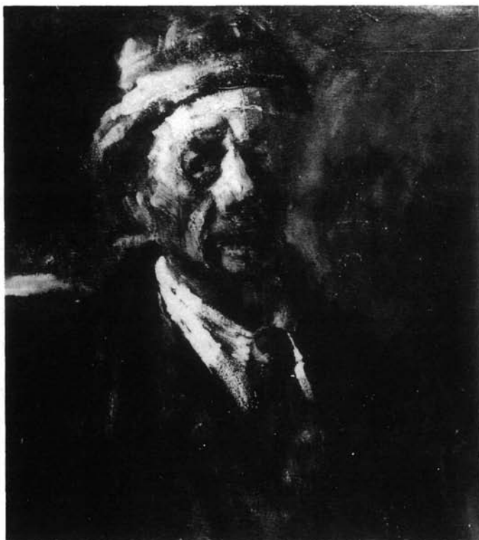
19. kép. Önportré, 1954. (funér, olaj, 73,5x60,5 cm Ltsz: HOM 83.161.)

vörös kalap mögé. A valór két szélső pontja: a sálszerűen illeszkedő gallér fehérje, s az ugyancsak ezt a mozgást követő kabát feketéje, egyben a kép ünnepélyességét is adja.