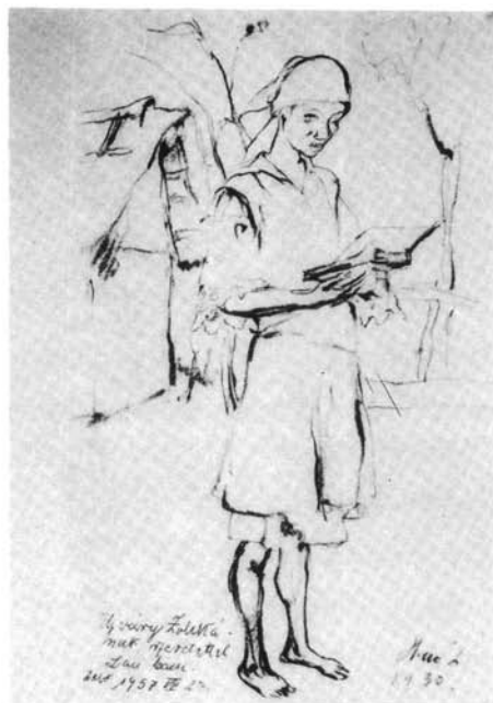
4. kép. Kertben olvasó nő, 1930. (p. szénrajz, 324x210 mm Ltsz: HOM 83.157.)