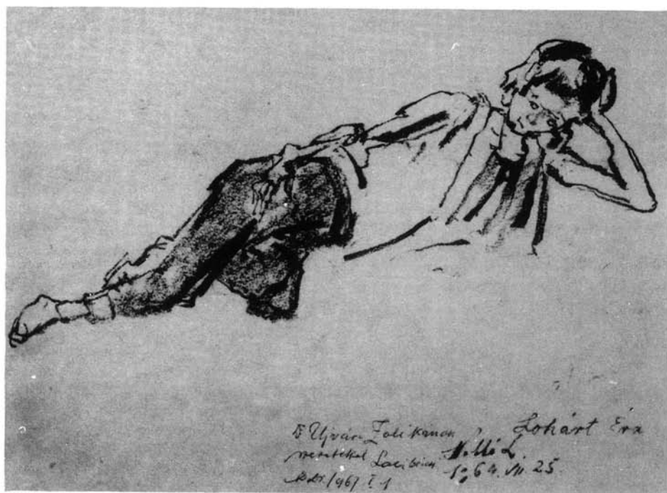
13. kép. Pihenő kislány, 1964. (papír, szén, 210x295 mm Ltsz: HOM 86.41.)