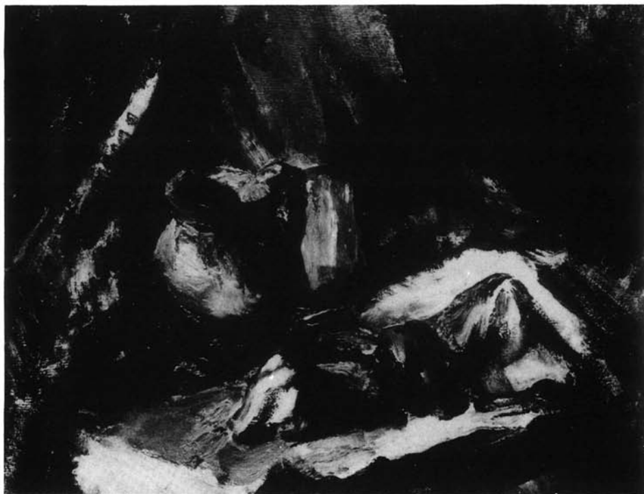
18. kép. Paprikás csendélet, 1951. (fa, olaj, 55x66 cm Ltsz: HOM 57.5.)

A Paprikás csendélet ben a barnamázás cserépedény színe az egész kép hangulatát meghatározza. A melegbe hajló okkerek, a narancsszínűvé, kraplakká tüzesített paprikák a hideg párizsi kék árnyék ellentétéként színesedik meg, s ezáltal egy, a mindennapnál érdektelenebb témát Holló ízig-vérig kolorista művé képes fokozni. A színek drámai ereje, a barnák tragikus mély tüze az alföldi mesterek balladai világát idézi. A Debrecen-környéki nép lelkületét és a Tisza-mentieket belülről láttató festő ezúttal szobájából a bíborba hajló drapériával rekeszti el azt, amit témául választ, s amiben – mint megannyiszor – önmagát teljességgel képes adni. E szűk keretek közé fogott világban benne van a magyar művészeti tradíciót kialakító alföldi mesterek lényeglátása. A színekben feszített ellenpólusok drámája, a három tárgyi elem puritánsága, s az expresszív megjelenítő erő – a legjobbak közé emeli Hollót.