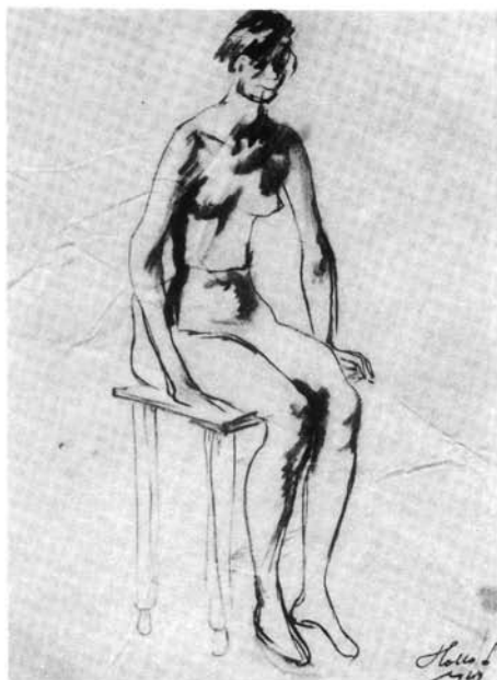
2. kép. Akttanulmány (Papír, ceruza, 300x230 mm Ltsz: HOM 86.34.)

A nép életével foglalkozó tudóst elsősorban azok a lapok ragadták meg, melyeknek témái azonosak voltak saját