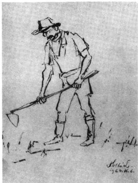
11. kép. Tanulmány, 1964. (p. szén, 273x211 mm Ltsz: HOM 86.36.)