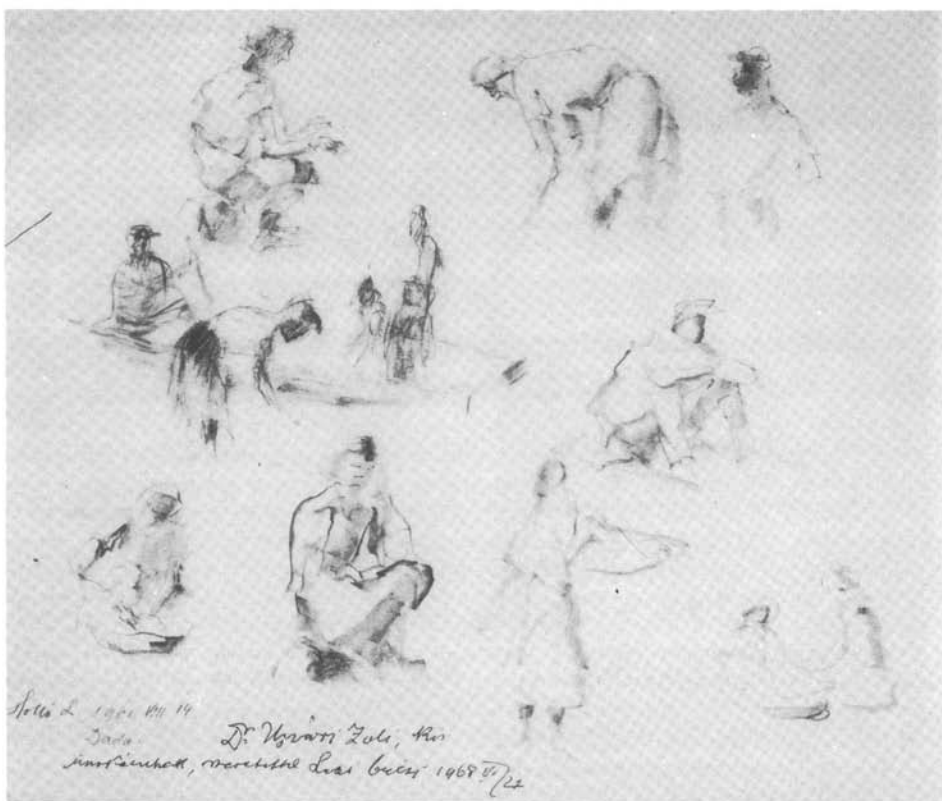
10. kép. Tanulmány, 1961. (p. ceruza, 260x325 mm Ltsz: HOM 83.160.)

A kaszálókon talán csak a vízzel oldott grafikai anyag inspirálta a festőiségre a művészt, mert pár évvel későbből való tanulmányain, mint pl.: Mozdulattanulmány 1936. c. ceruzarajza (papír, ceruza 240x303 mm Ltsz: HOM 86.38) továbbra is a formát követő vonalakból alakítja ki a földön ülő, háncsot húzó figurát. Ezúttal a mozdulat négy fázisa alakít ki egy művészi egységet.