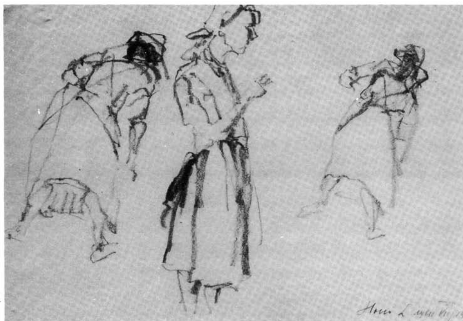
9. kép. Tanulmány, 1941. (p. cëruza, 230x295 mm Ltsz: HOM 86.37.)

szakterületével: a magyar paraszti lét hétköznapjaival, a mezőgazdasági munkával, az állatokra vigyázó gyerekek játékos vidámságával. Holló, mint a magyar festők közül a leginkább az alföldi mestereknek – ezt a természetközeli életet – művészi magaslatra tudta emelni.