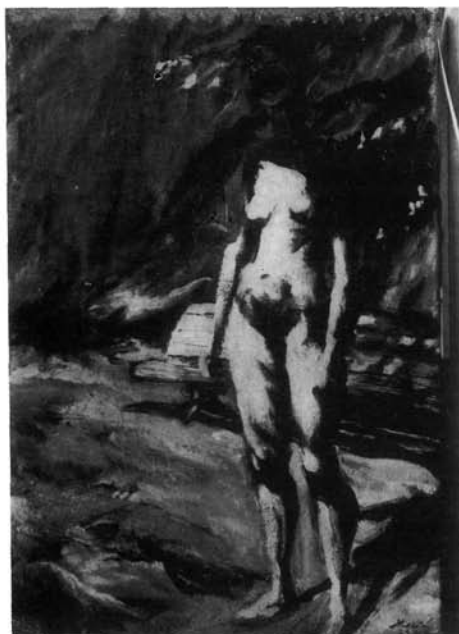
1. kép. Akt a kertben (Olaj, vászon, 75x50 cm Ltsz: HOM 74.70.)

re, a vetett árnyéokra, a középtérbe állított padra. A modell szépsége a megfogalmazás áldozatává válik, de kifejezésének hitele erősödik általa.