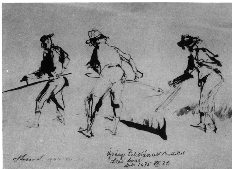
6. kép. Kaszáló, 1934. (p. diófapác, 215x308 mm Ltsz: HOM 83.158.)