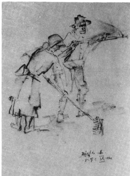
12. kép. Szénagyűjtők, 1971. (p. ceruza, 230x208 mm Ltsz: HOM 86.42.)