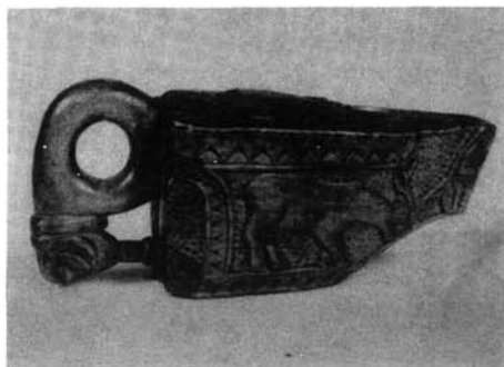
6. kép. Kosfogós, ún. kacsacsőrű fedeles csanak, oldalán szarvas. (DIVM 54. 34. 1.)