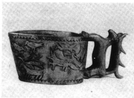
8. kép. Szarvasfogós csanak, oldalán erdei állatok, madarak. (DIVM 54. 213. 1.)