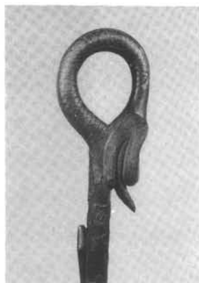
11. kép. A kígyós bot egyik példánya (DIVM 54. 229. 1.)

A kígyóábrázolások legfőbb sajátosságának azt tarthatjuk, hogy az alkotó a figurális megjelenítés változataiban a látvány, a dekorativitás és a használati funkció, a stabilitás egységét hogyan tudta megoldani.