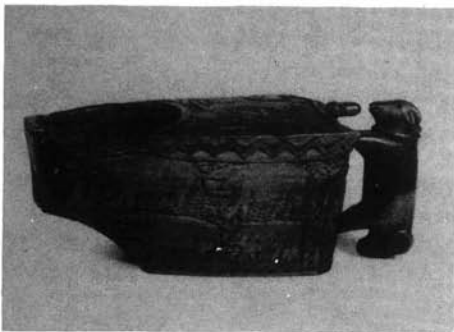
7. kép. Kosfogós fedeles csanak, oldalán legelésző konda. (DIVM 54. 216. 1.)