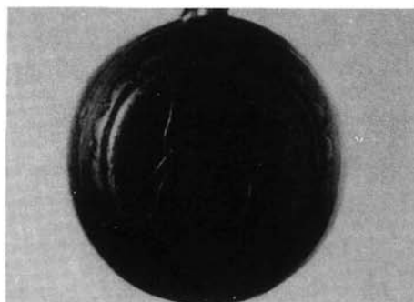
3–4. kép. Stilizált kígyófogós „jágerkanál”, talpán szarvas (HOM 53. 921. 1.) Szőketanya