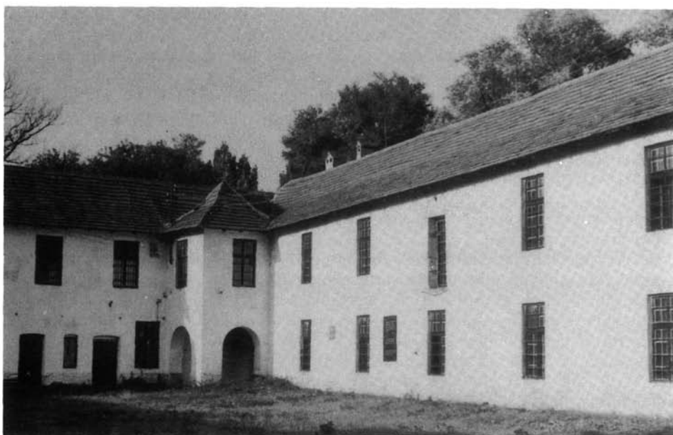
6. kép. A borsosújfehértói várkastély múzeumi szárnya

Egy 1932-es kiadású sátoraljaújhelyi útikalauz 11 szintén a Dókus-féle magángyűjtemény gazdagodásáról tesz említést: „Sátoraljaújhely város és határainak területén, ahol nagyobb földmunkákat végeztek, így a herceg Windischgrätz-féle, a torzsási téglagyárban és a bibérci homokbányában, valamint a Ronyva-patak év-év utáni partleomlásában, a csiszolt és pattintott köeszközöknek, továbbá a bekarcolt és festett díszítésű cseréptöredékeknek nagy mennyisége került napfényre. Ez őskorú emlékek nagy része a Kassai Múzeumba, a Magyar Nemzeti Múzeumba és magángyűjteményekbe került (s minthogy tudományos folyóiratokban is ismertették, az arra hivatottak csakhamar megállapították azt, hogy a Sátorhegy alja értékes őskorú emlékekben hazánk egyik leggazdagabb területe.” (A fentebb ismertetett leletanyagot „újhelyi kultúra”-ként ismeri a régészeti szakirodalom. Szerencsére a Herman Ottó Múzeumba is jutott belőle bőven; napjainkban egy kollekcója látható az újhelyi állandó kiállításban is.)