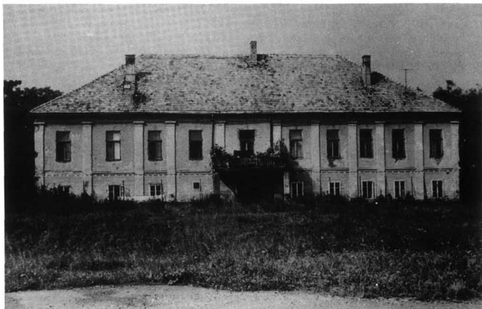
3. kép. A Dókus-kastély, Sátoraljaújhely első múzeumépülete

nyét gazdagították. A későbbiekben azonban tudatossá vált a kutatás, hozzáértő emberek bekapcsolódásával. Az akkori régészeti feltárások szakszerűségére vonatkozik a következő idézet: „Kozma Menyhért vécsi birtokos nagy szorgalommal tárta fel általában a zempléni kultúrmaradványokat. Eme úttörő munkájában legmegértőbb támogatója és pártfogója Dókus Gyula, vármegyénk régész alispánja volt. Ők már szakszerűen járnak el a feltárásnál. A sírokat kiássák, a lelőhelyeket megtisztítják, és azokról fényképeket készítenek. Az igen értékes leleteket a régész alispán összegyűjti, házimúzeumot létesít azon nemes szándékkal, hogy gyűjteményével a Zempléni vármegyei Múzeum alapját vesse meg. Segítőinek tábora örömdetesen növekszik, és az Adalékok szerkesztősége, élén Dongó Gyárfás Géza vármegyei főlevéltárnokkal, fáradságtalanul végzi a leletek tudományos ismertetését is. Csatlakozik hozzájuk Jósa András dr., Szabolcs vármegye nagy régész-főorvosa. Ennek a lelkes gárdának több évtizedes munkáját megkoronázza az a számos lelet, amely Zemplén vármegyét, illetve annak bodrogvécsi részét a honfoglalás kori emlékek leggazdagabb lelőhelyévé emeli.” 4