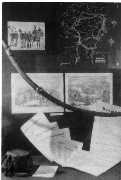
7. kép. Részlet a Kazinczy Múzeum kiállításából