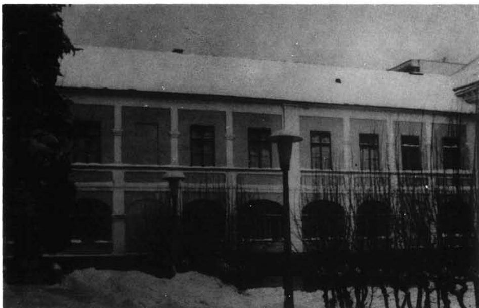
4. kép. A vármegyeháza új épületszárnya, levéltár és a Zemplénvármegyei Múzeum elhelyezésére