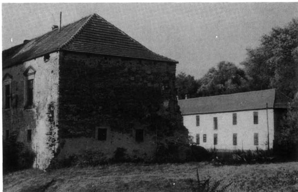
5. kép. A borsos várkastély

A bodrogvécsi lelet 1897-ben szőlőmunkálatok alkalmával egy homokos dombon került elő. Fettich Nándor dr. megállapítása szerint két lemezből áll: a felső finom ezüst és mintázott, háttérében aranyozott, az alsó dísztelen lemez vörösréz-ből készült. A két lemez körös-körül 25 szeggel van összegezve, ezenkívül fönt és lent a rozetta alatt 3–3 szeg szerepel, amelyek a tarsoly felfüggesztett szíját tartották. Ez a lemez a szolyvai és bezdédi tarsolylemezekkel rokon. Fettich mindkettőn normann hatást is megállapít. Mindkettő legértékesebb emlékét képezi a honfoglalás kori fémművészetnek.” (Ma mindkettő a Nemzeti Múzeumban látható.)