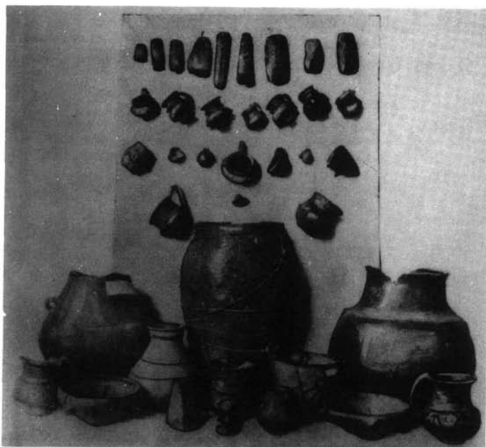
2. kép. Kő-, cserép- és bronzleletek Dókus Gyula régészeti gyűjteményében