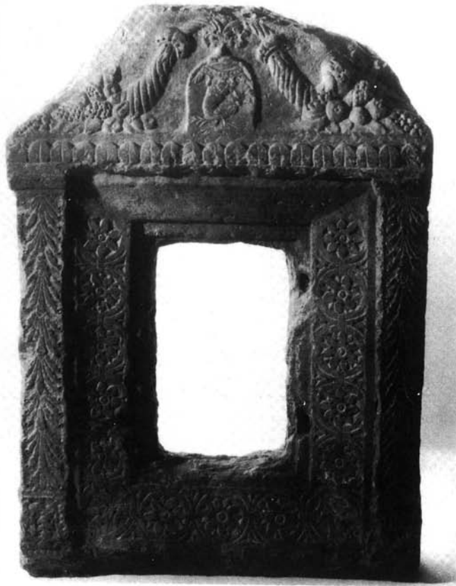
1. kép. A sajókazai tabernákulum

tek), valamint a Szathmáry György püspök által az 1510-es években Pécsen készíttetett), amelyek monumentális felépítettségük (a pestiek 746 cm magasak és 254 cm szélesek!) valamint gazdag és kitűnő dekorációjuk folytán, hiszen hasonló nagyszerű tabernákulumok még Toszkanában is ritkák.