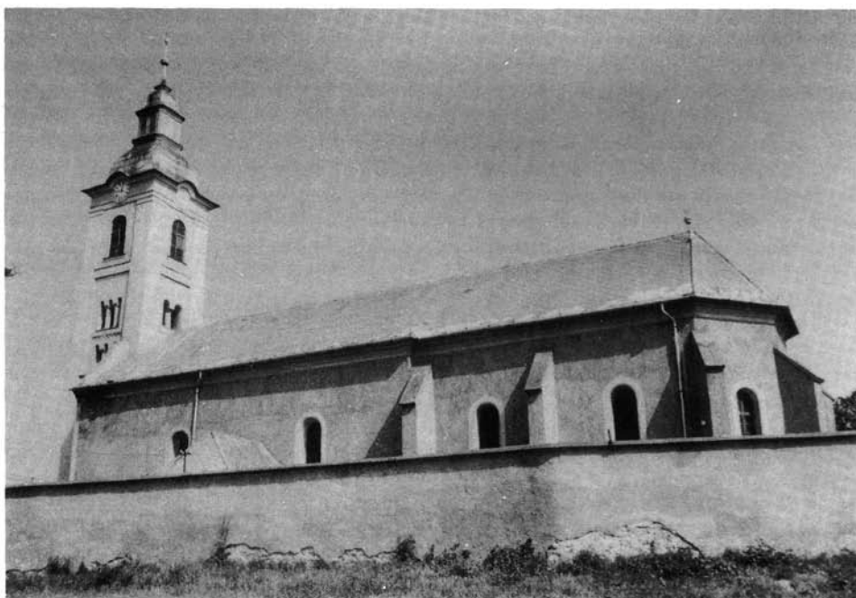
3. kép. A sajókazai ref. templom déli nézete