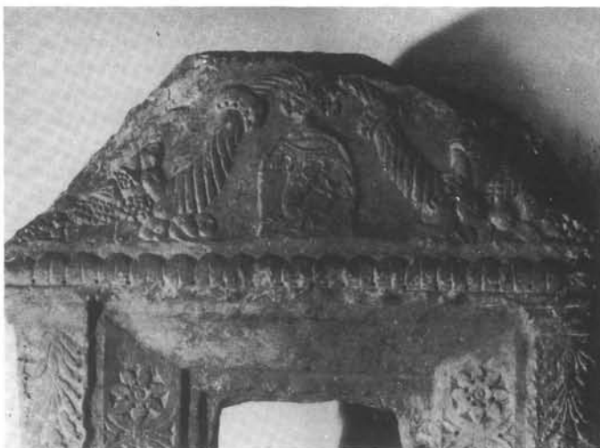
2. kép. A sajókazai tabernákulum címeres lábazata

foglalkoztatott többi nagy művész még Mátyás halála után is folytatott egy darabig munkásságot hazánkban, vagy hatott tanítványai útján.