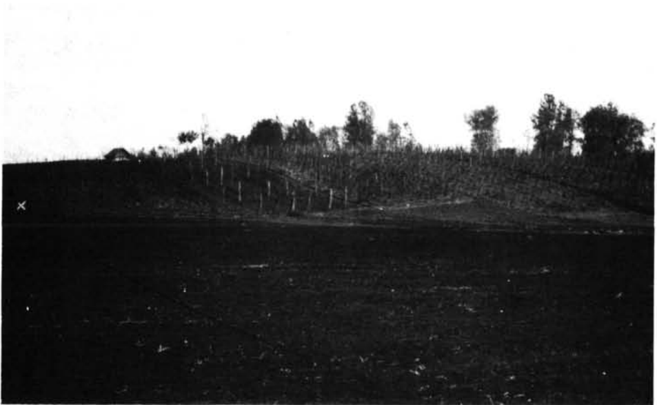
2. kép. A Várdomb képe délről. X A bronzok lelőhelye