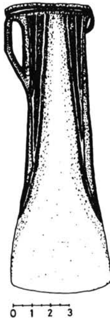
5. kép. Erdélyi típusú balta