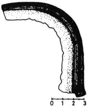
4. kép. Egygombos sarló