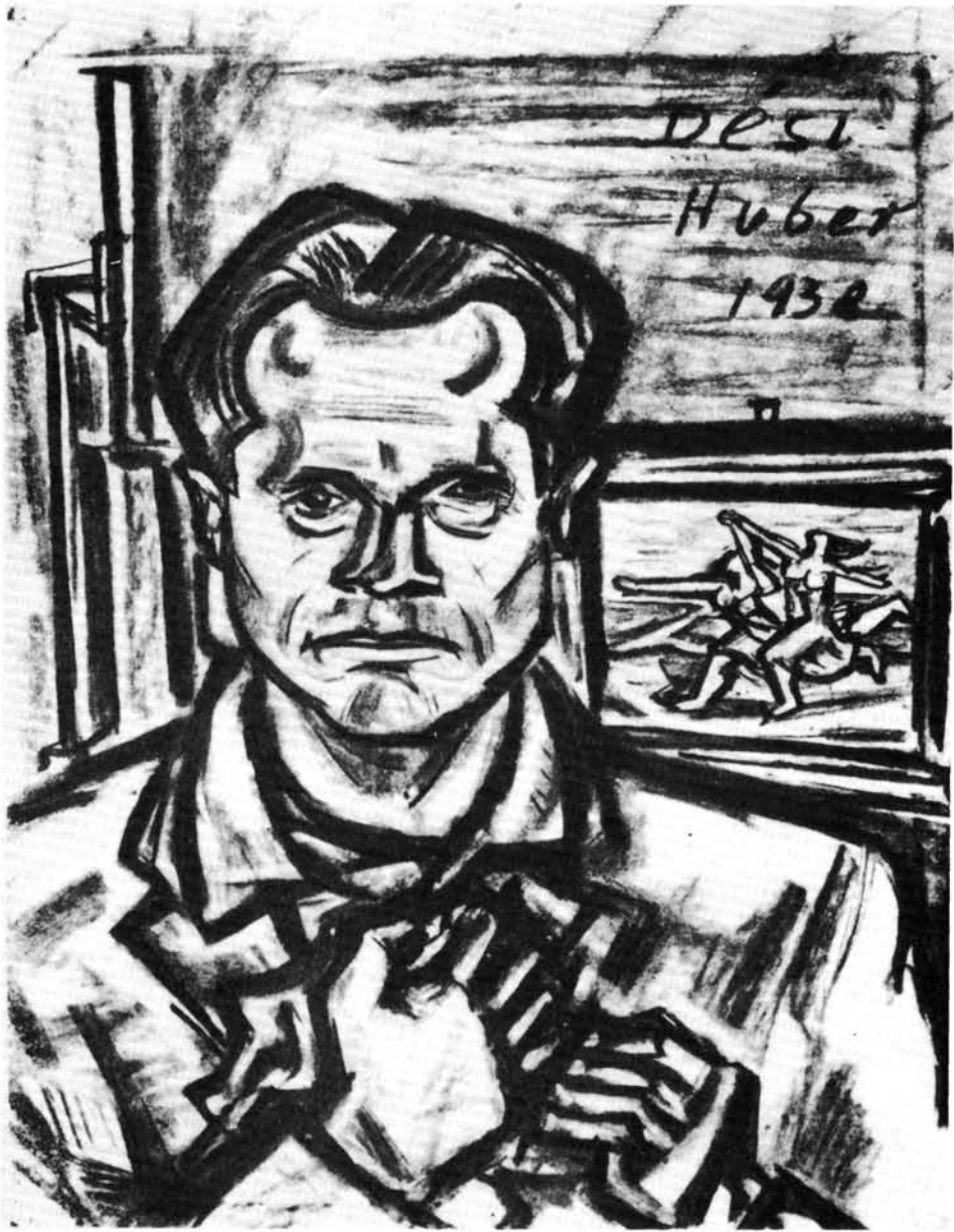
2. kép. Önarckép Picasso-képpel (Önkínzó önarckép) – 1938