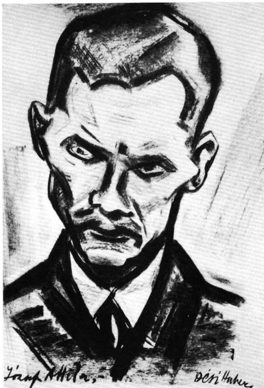
7. kép. József Attila – 1937