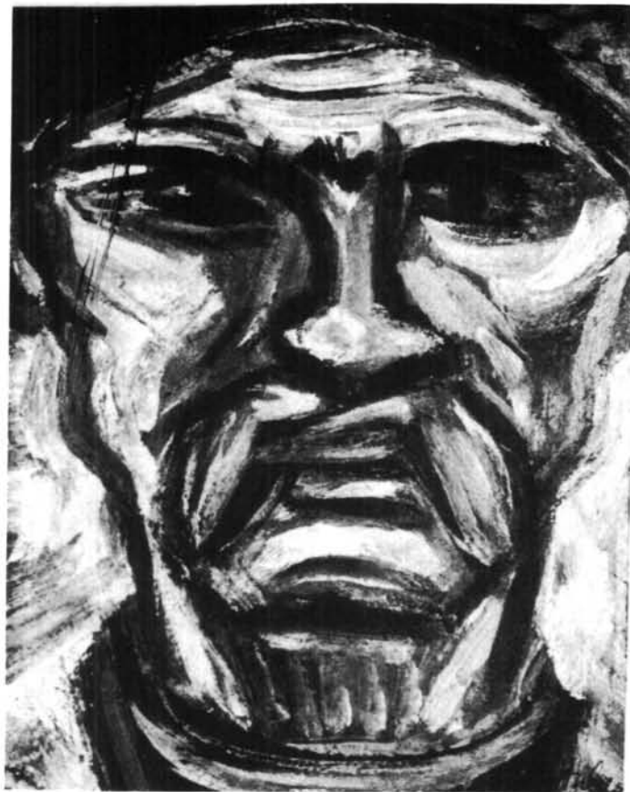
4. kép. Kucsás paraszt – 1939