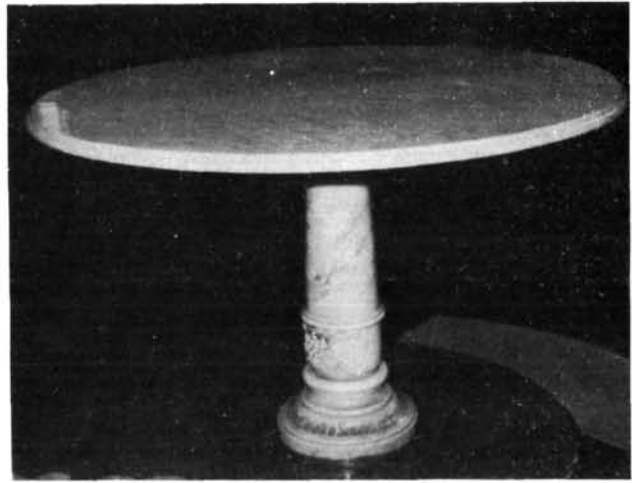
6. kép. Úrvacsoraosztó márványasztal a református templomban

A fellelhető korabeli iratokból (jegyzőkönyvekből) kitűnik, hogy a társulat többsége, később egésze elismerte ugyan az ipartörvényt, de évek teltek el (1873–1875) amíg megszilárdult a munkát biztosító rend és fegyelem, s ez ideig ragaszkodtak a korábbi céh szervezeti élet általuk jónak, hasznosnak vélt tevékenységéhez. A céhbiztos, atyamester gyakorolta hivatalát, felléptek a fegyelmetlenkedőkkel, a lopás büntetteket elkövetőkkel szemben.