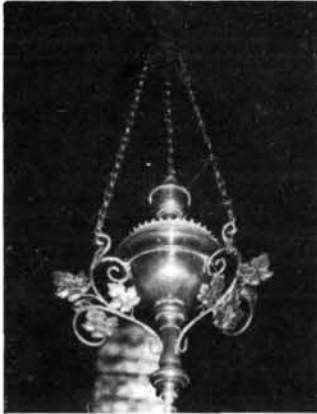
5. kép. A római katolikus templom örökmécse