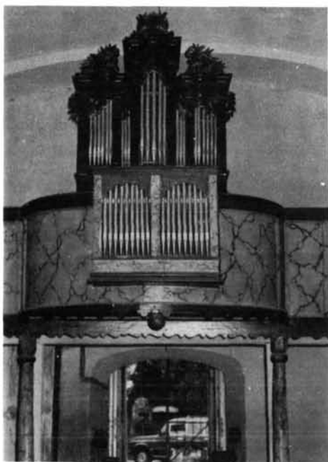
3. kép. Az evangélikus templom orgonája