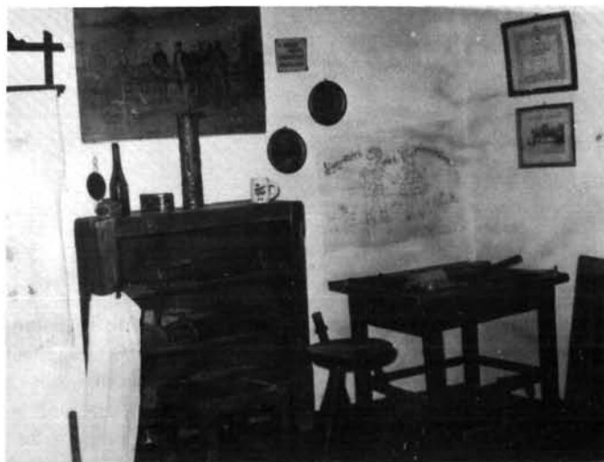
1. kép. Csizmadiaműhely a helytörténeti gyűjteményben (A képek Antal János felvételei)

A csizmadiacéh elöljáróságát a céhbiztos , főcéhmester , másod céhmester , céh jegyző , az atyamester , a kulcsos bejáró , a másodbejáró és két céh szolga alkotta. A céhbiztost, aki jogi személy volt (bíró vagy ügyvéd) a közgyűlés először választotta meg, hogy a többi tisztségviselők – akik hasonlóan közgyűlésen lettek szavazatok alapján megválasztva – letegyék kezébe az esküt. A céhbiztos védte a kézműipari közösség jogi érdekeit, mint legfőbb választott személy a közgyűléseken elnökölt, ellenőrizte a mesterek szerződés kötéseit a tanulókkal és a legényekkel szemben. Ebben segítőtársai voltak a fő- és másodcéhmester. A céh elöljáróságnak joga volt pénzbüntetést kiszabni; ezek törvényességéről győződött meg a céhbiztos. Ilyen pénzbüntetést maga után vonó szabálytalanságok voltak: a mesterek visszaélései alkalmazottaikkal szemben, mesterlegények, inasok magatartásbeli problémái (fajtalan beszéd, anyaglopás, ittasság stb.). Ugyancsak büntetéssel járt a vásárhelyeken tapasztalt szabálytalanság (árrágítás, kontártermék árusítása, a kijelölt árulóhely el nem fogadása, mestertársakkal, vagy vevőkkel szemben tanúsított durva beszéd alkalmazása). Az elöljáróság által kiszabott pénzbüntetések jogi érvényességét a céhbiztos vizsgálta felül. Éberrel ellenőrizte, hogy a közönséges, vagy közgyűlések szabályosan lettek-e összehívva (hirdetés, tábla kiküldetésével). Gondja volt a gyűléseken a szavazatok tisztaságának elbírálásában.