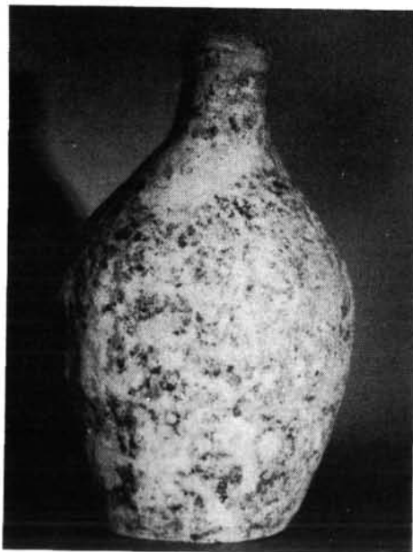
2. kép. A Sajólad–Kemejen talált palack

Elszórtan császárkori töredékek is kerültek elő a községtől északra. (Ltsz.: 84.7.1–84.13.6.)