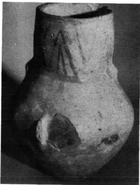
1. kép. Késő neolitikus festett edény (Bodrogkeresztúr)