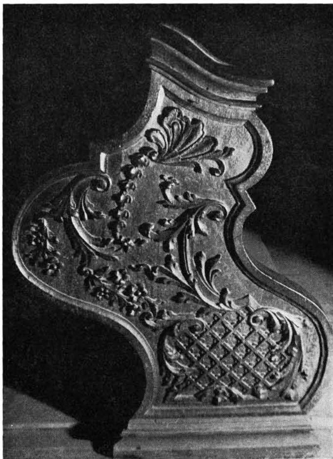
3. kép. Faragott rokokó padoldal a keresztelőkúttal