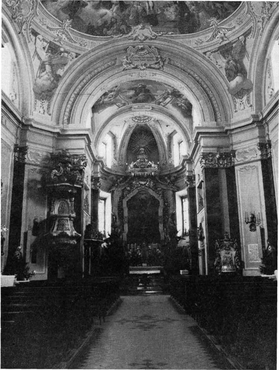
2. kép. A mindszenti templom főoltára a szőszékkel szata