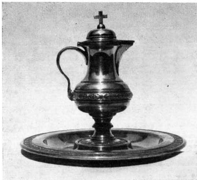
4. kép. Keresztelőkészlet