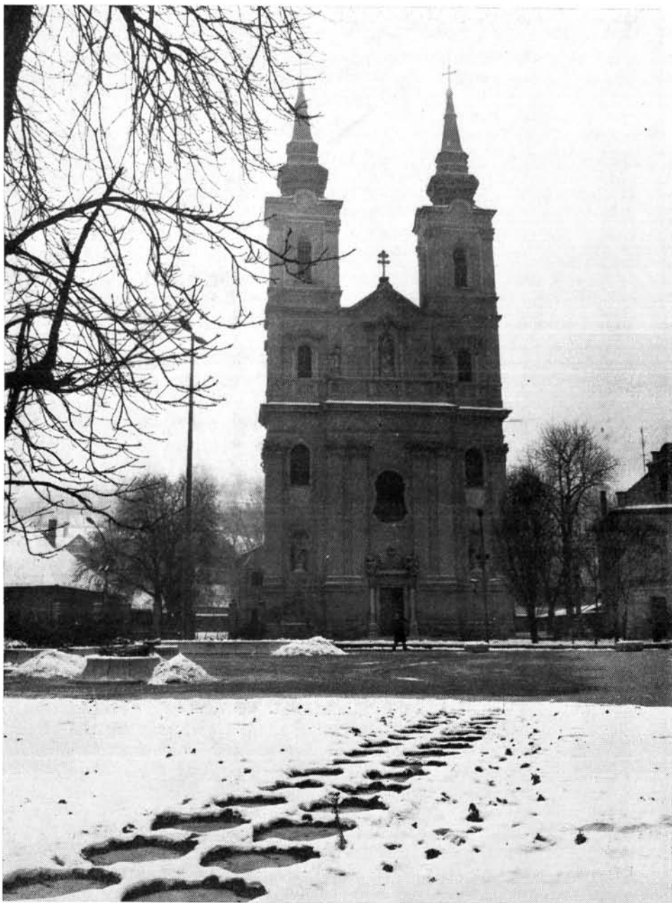
1. kép. A Mindszenti templom főhomlok