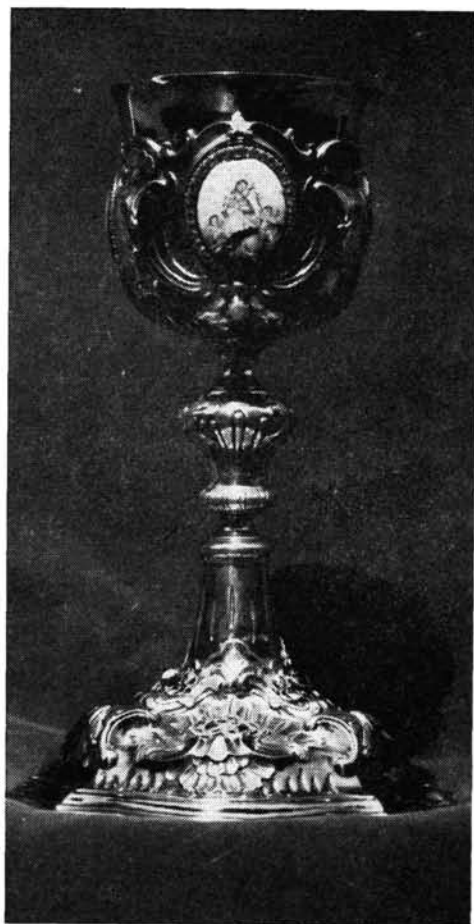
6. kép. Kehely festett zománcképekkel