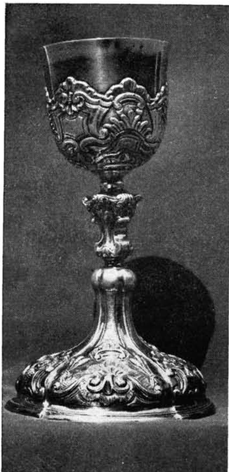
5. kép. Kehely