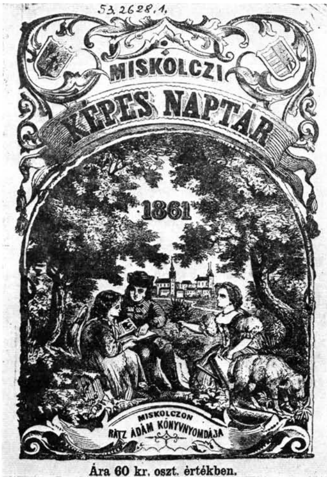
3. kép. A Miskolczi Képes Naptár 1861-es kötetének címlapja