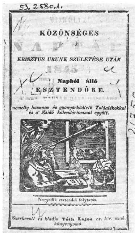
2. kép. A Miskolczi Közönséges Naptár 1845-ös kötetének címlapja