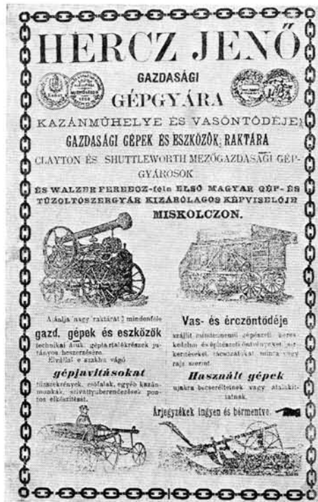
4. kép. Hercz Jenő gazdasági gépgyárának hirdetése a Miskolczi Képes Naptár 1885-ös kötetében

Wagner-féle Szelényi nyomdával, s ebből létesült Klein—Ludvig—Szelényi név alatt a Miskolci Könyvnyomda RT. 50