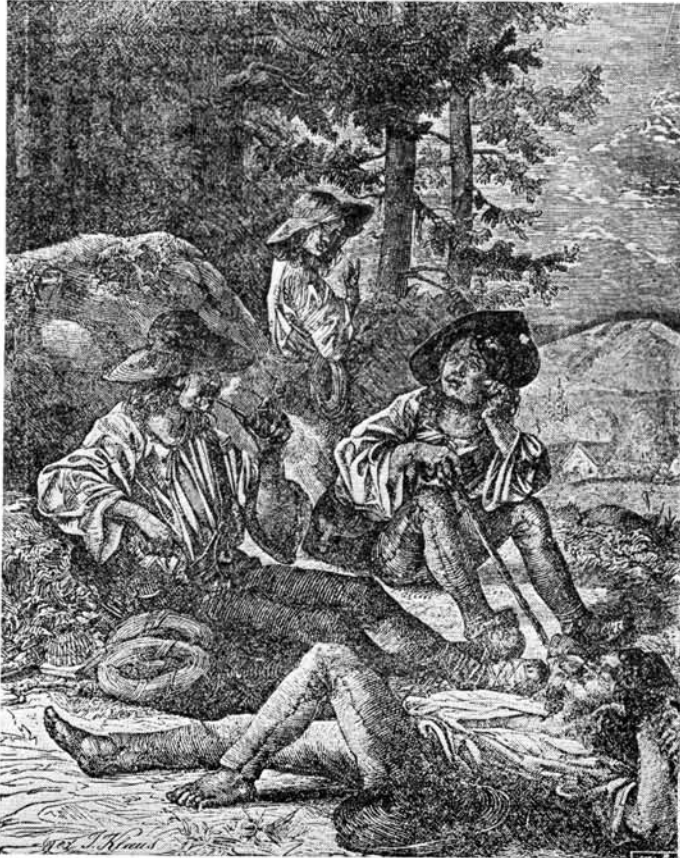
6. kép. Drótostótok a Miskolczi Képes Naptár 1880-as kötetében

Az I. forráscsoport, a nyomtatott adatok alapján azt kell megállapítanunk, hogy közülük messze kiemelkedik a gyógyászati adatok száma és jelentősége. Ez a gyógyítás és a betegség alapvonásaival magyarázható. A beteg vagy annak környezetében élő személyek a gyógyulás reményében mindenféle újabb receptet, tanácsot kipróbálnak, ill. kipróbáltatnak. Ehhez nem szükséges lényegében még a szűk közösség szerepe, jóváhagyása sem, s az esetek nagyobb részében a gyakorlása is egyéni. Ez lehetett tehát a legnagyobb hatással a kalendárium