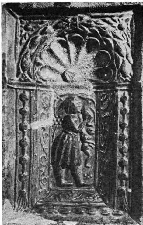
6. kép. Reneszánsz kályhacsempe „gyerekfaló nő” alakjával. Diósgyőr

elejére fejlődik ki, s a huszárság 1570-ig viseli. 26 Tehát a csempén látható huszár az 1500—1570 közötti huszár viseletet tükrözi.