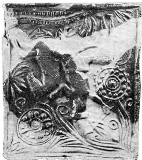
2. kép. Huszárábrázolásos kályhacsempe a XVII. sz. második feléből. Diósgyőr