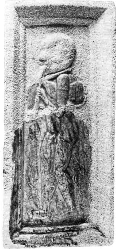
7. kép. „Furulyázó faun”-feles méretű kályhacsempék Diósgyőrből