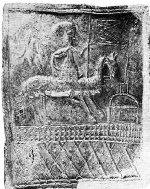
1. kép. Huszáralakos kályhacsempe a XVII. század elejéről. Diósgyőr