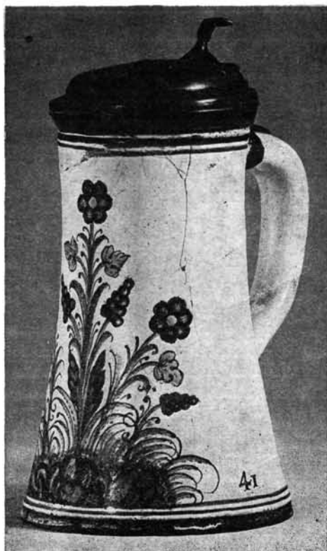
1. kép. Kupa, 1641-es évszámmal.

Egyesek szerint Rákóczi György az 1645. évi felvidéki hadjáratkor jutott arra az elhatározásra, hogy habánokat telepít Sárospatakra. Egy feleségéhez írott levelében oly értelemben szól a telepítési akcióról, mely kettőjük között korábban elhatározott. Cristoph nevű emberének megadta az utasítást, hogy mennyi és minémű szakemberek menjenek, mégpedig jó mesterek. A habán krónikák a következőképpen adják elő az eseményt. A hadak várható fosztogatásai elől a csejteiek a fejedelemhez fordultak oltalomért, akinek, hogy jóindulatát kieszközöljék, étellel, itallal kedveskedtek. Ezt az alkalmat használta ki a fejedelem arra, hogy tájékoztassa őket letelepítési szándékáról. Hiába próbálták a megrettent közösség vezetői eltéríteni ettől, a fejedelem hajthatatlan maradt. Végül is, amikor meggyőződtek jóakarataról, elhatározták, hogy a közösség érdekében mindnyájan útrakelnek. Augusztus 25-én indult el a szekerekből és kíséroból álló menet. Mikor értek Patakra, nem tudjuk, tekintettel azonban arra, hogy útjuk katonajárásos, háború-sújtotta területen vezetett át, feltehetőleg hosszabb időt vett igénybe. Az áttelepülők