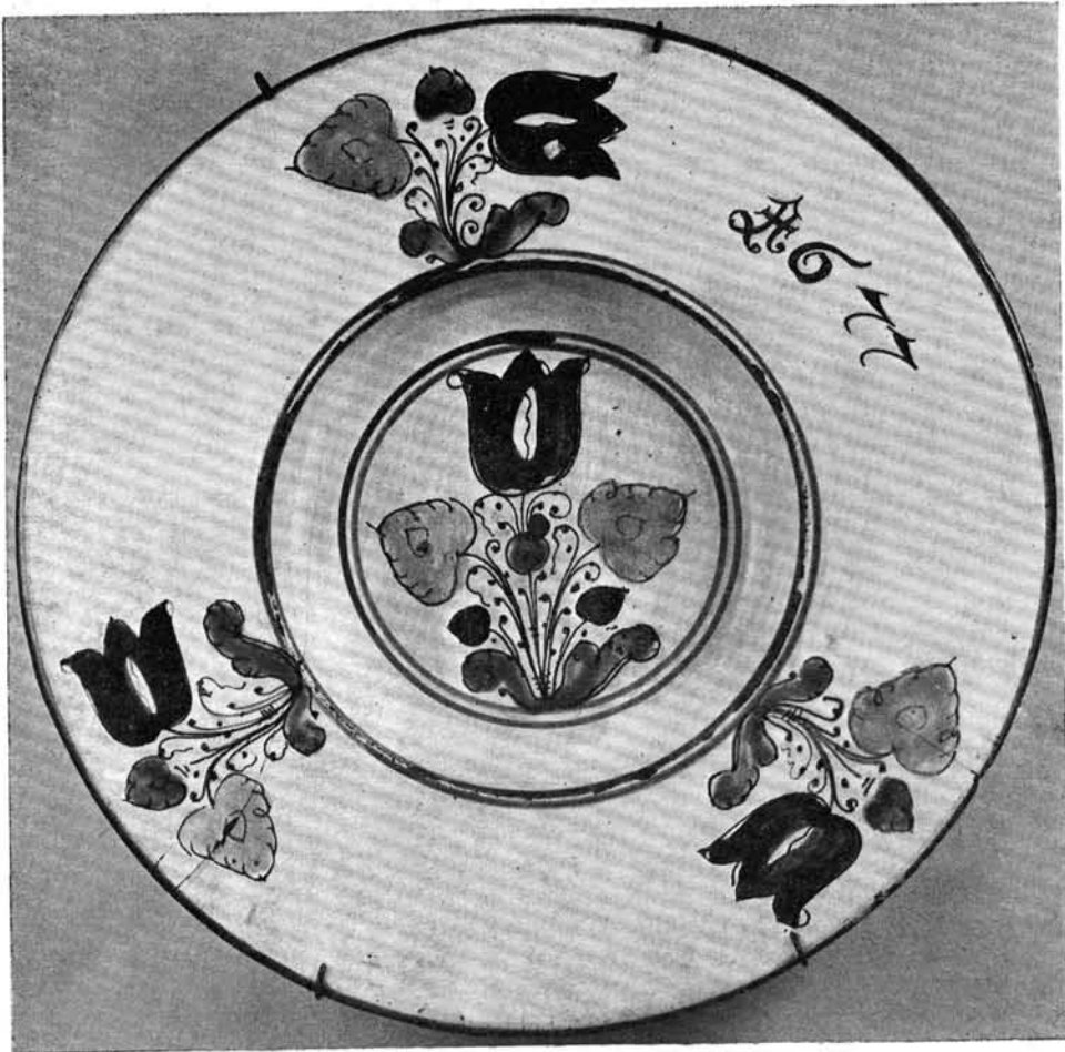
5. kép. Tál, 1677-ből

egyek típusok közötti hasonlóságot és különbséget sem sikerült tisztázni. A habán kerámia egyes típusait — a fehéret ugyanúgy, mint a lila-, kék- vagy sárga alapút — egyaránt az ónmázás fajansz kategóriájába sorolták, következésképp előállításuk, készítményük kérdéseiben sem differenciáltak. A cseh Landsfeld , s az ő eredményeire támaszkodó cseh kutatók megkülönböztették ugyan a habánok ónmázás fajanszait az engóbos és ólommázás készítményektől, a magyar kutatók azonban az ón- és ólommáz pontatlan fordítása következtében végleg összekeverték a kérdést. Így oly összevisszaságot teremtettek, mely megnehezítette az egyes típusok felismerését. A következőkben megpróbáljuk ismertetni a habán kerámia egyes típusait és előállításukat. Előbb azonban a habán kerámiák jellegzetességeit ismertetjük röviden.