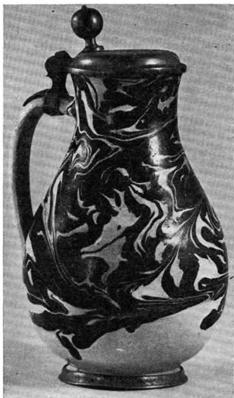
7. kép. Korsó, márványos technika, XVIII. sz. eleje

A kék intenzitása a keverékben levő kobalt mennyiségétől függött, valamint az engóbot alkotó agyag színétől. Ha az agyag vörösre égő volt, lilás-kéket, ha fehérre égő, levenduláskéket nyertek. A levendula-kékes habán edények az erdélyi Sigerus-féle gyűjteményből kerültek az Iparművészeti Múzeumba 1917-ben. A levendula-kék készítmények ritkábbak, — mint ahogy a fehérre égő agyag is ritkább a vörösre égőnél. A kék kerámiák nagy része mély lilás-kék tónusú, az engób-keveréket alkotó vörös agyag miatt. A kék mélysége, intenzitása esetenként különbözött. Ugyanazt a kéket — árnyalatnyi pontossággal — a legritkábban tudták csak előállítani, bár valószínűleg nem is törekedtek teljes színhúségre. A levendula-kék edények a kék kerámiák között is külön csoportot alkotnak. Túlnyomó részük lilás-kékes a Felvidéken ugyanúgy, mint Erdélyben. Ezt bizonyítja azoknak a kerámiatöredékeknek a vizsgálata is, melyeket a cseh Landsfeld ásott ki Dejthén, Szobotisten stb.