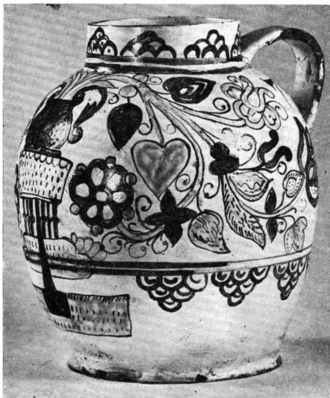
4. kép. Korsó, XVII. század második fele

egyszerűbben és kevesebb ellenállással ment végbe, mint az ország többi részein. Bár a sárospataki fazekasságnak a habán művességgel való közvetlen kapcsolata ugyan mindmáig nem bizonyított, néhány adat azonban kétségtelen mutatja, hogy a két művesség között kellett valamilyen — esetleg közvetett — kapcsolatnak lennie. Már Román János nak is feltűnt az a sajátos fluktuáció, mely a sárospataki fazekasok között a XVIII. század elején végbement: „A pataki fazekasok... a habánok idejében nem lakhattak a mai Fazekas soron, de... még Nagy-Patakon sem... egészen 1735-ig. 1712-ben viszont Kis-Patakon, a Bodrog bal partján találunk hat fazekast, akiknek száma a század végéig fokozatosan fogyott, de még 1785-ben is akad belőlük a régi helyen. Ugyanakkor szaporodó számban találjuk őket 1735 tájától Nagy-Patakon, pontosan a habánok telepe alatt, tehát a mai Fazekas sor városfelőli végén. Jó ideig csoportosan helyezkedtek el ott, csak a XVIII. század végén kezdett településük a mai Fazekas sor hosszában nyúlni, bizonyára a műhelyek számának szaporodása következtében. „Érdekes, hogy az ugyanezen évtize-