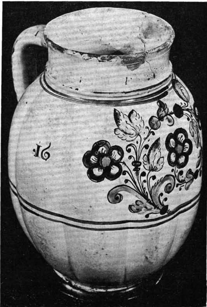
3. kép. Korsó, XVII. század második fele

sen nyugodtnak és biztonságosnak — olvashatjuk Román János nál —, mert az 1663-ban Patakon is megjelenő jezsuiták csakhamar elkezdik térítési akciójukat. 7 Más forrásaink arról tudósítanak, hogy a béke és nyugalom ideje még tíz évnél is alig lehetett több, hiszen a jezsuiták már 1655-ben ott vannak Patakon 8 s már ekkor megkezdik térítési tevékenységüket nemcsak a reformátusok, hanem az anabaptisták között is. Kétségtelen, hogy az első próbálásaik szerényebbek, hiszen még él és aktív Lorántffy Zsuzsanna , a református érdekek képviselője. 1660 után azonban egyre fokozzák térítési kampányukat.