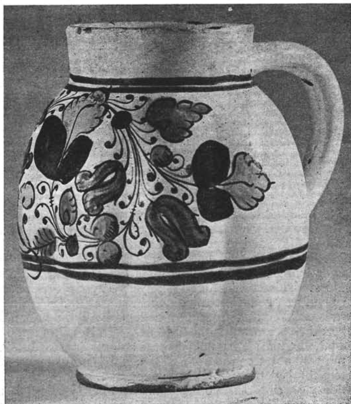
2. kép. Korsó, XVII. sz. második fele

A fejedelem a telepéseket a várostól, helyesebben a vártól keletre fekvő, ún. Hejcén telepítette le. Ez a rész tulajdonképpen már a várfalon és az árkon kívül feküdt egy magas és meredek dombocskán. A középkorban ágostonrendűek zárdája állott itt, mely a Perényiek alatt lebontatott s a körülötte levő egész terület közvetlenül a várhoz tartozó, taxamentes fundus lett. A XVII. század közepén már a várhoz tartozó, különböző személyek lakóhelye volt a terület, ami kitűnik a fejedelemnek abból az 1646-ban kelt adományleveléből is, mely szerint a pataki vár porkolábjának szánt egyik hécei házat át kell engednie a habánoknak lakóhelyül. Egyébként, Debreczeni Tamásnak Sárospatakon, 1646. július 15-én Lorántffy Zsuzsannához írott leveléből értesülünk elsősízből arról, hogy a habánok már Sárospatakon laknak. Az újkeresztény ácsok „oda innét nem mehetnek, — olvashatjuk — mert ezek magok is most épülnek és ha azt elhagynák, az magoké elmaradna ez esztendőben is; vincziek