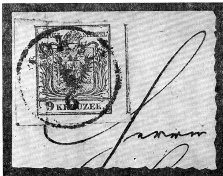
3. kép. Felnagyított tokaji-fogazott bélyeg ügyetlen kézi perforálás jegyeivel, feladási időpont 1853. június 4.