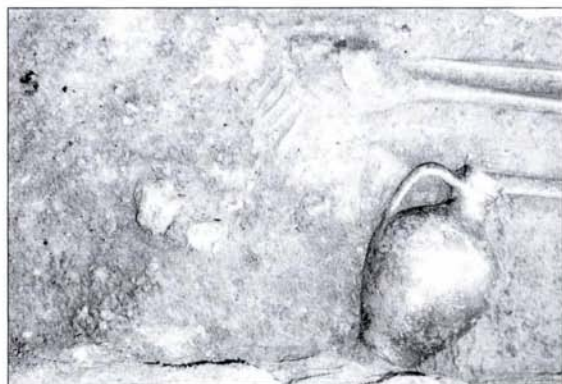
5. kép: Az 59. számú sír részlete Fig. 5.: Grave no. 59 (detail)

district were unearthed on lot 8 Vályog Street, north of our territory, in 1995. (MADARASSY 1996, 53-60.) At this time, the last phase of the Roman period, from an area south of the road, could be observed. The building was reconstructed between the reign of Caracalla and