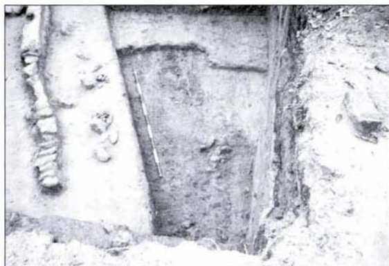
4. kép: Sorba rakott gerendák Fig. 4.: Beams in a row

bontották le, a tetőgerendákat egy sorba rakták, (4. kép) majd ezután bontották el a falakat, a főfalak kőanyagát elszállították, a vályogtég-lából épített osztófalakat pedig elplanírozták a területen, ezeknek a kőalapozása a földben maradt.