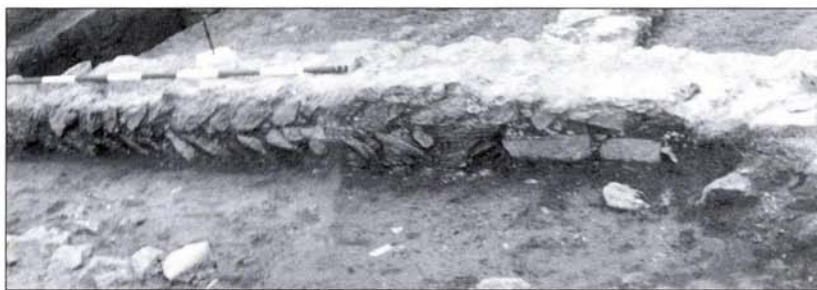
2. kép: 3. századi perystilium fala és alatta az elbontott 2. századi pillér nyoma Fig. 2.: The wall of the perystilium from the 3 rd century and the trace of pulled down pillar from the 2 nd century

Archaeological excavations were conducted preceding the foundation of a block of flats by the PROPSZT Szerkezetépítő Kft. on lot 34 Selmeci Street. A fragment from a larger dwelling house in the Military Town was unearthed. Its end walls are probably under the road surface of Selmeci Street in the north and that of San Marco Street to the east. The unearthed dwelling rooms encircled a courtyard with a perystilium. The original building was constructed at the beginning of the 2 nd century and then was nearly totally reconstructed in the first decades of the 3 rd century. (Fig. 2.) The house was improved three more times in the first half of the 3 rd century. The building was pulled down during the landscaping work which has been dated to the 70s of the century. The stone material from the walls was used for leveling of the surface.