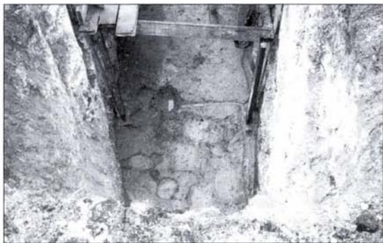
3. kép: Cölöpkonstrukciós védműrendszer nyoma Fig. 3.: Traces of the post-structure defence works

The remains of the dismantled wall of a house from the 2 nd – 3 rd centuries and