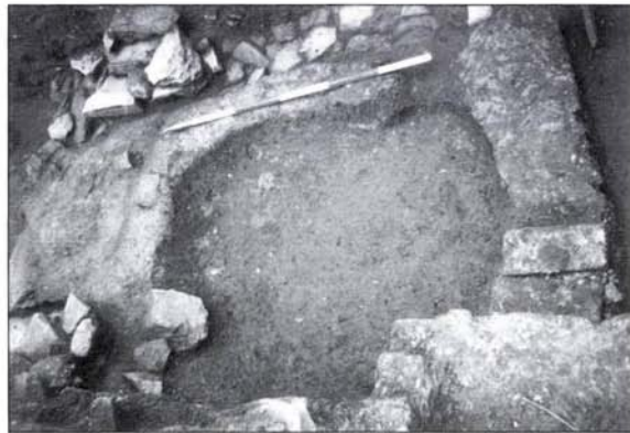
4. kép: Severus-kori konyha részlete

New rows of rooms were added to the large blocks of houses opening onto the limes road in the 3 rd