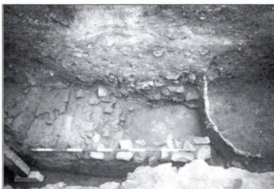
5. kép: Fűtőcsatorna Fig. 5.: Heating channel

borította a területet, melyre egy többször átépített monumentális hypocaustum épületet emeltek. Az újkori bolygatások miatt csak a hypocaustum alépitményének alapfalait, és egyetlen fűtőcsatorna részletét figyelhettük meg az épület keleti részén. (5. kép) A területen előkerült érmek alapján ezt az épületet még a 4. század folyamán is használhatták, az utolsó átépítés a negyedik század második felében történhetett.