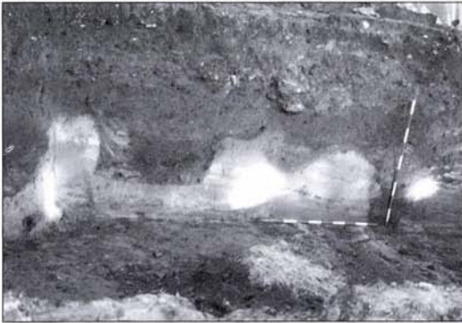
3. kép: Különböző típusú növények gyökerének nyoma a metszetfalban

Fig. 3.: Traces of the roots of various plants in the section wall