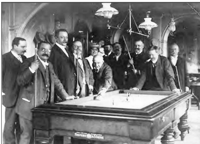
5. kép: Biliárdozók 1900 körül (Szántó András: Kávéházi játékok. Budapest. A városlakók folyóirata. 2017/3, 12.)

Az egyesület kapcsolatrendszerében további természetes, magától érthető jelenség volt, hogy hosszú évek során jó, baráti kapcsolatot alakítottak ki testvérszervezetekkel, közöttük is különösen a győri és a kőszegi egyesülettel. Többször találkoztak ismerkedés, eszmecsere céljából. A győri Kör két alkalommal is tartott Sopronban színvonalas, nagy sikerű kultúrestet, amit az egyesület győri vendégszerepléssel viszonzott.