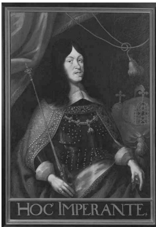
13. kép. Ismeretlen festő (Jan Thomas nyomán?): I. Lipót mint német-római császár, 1660. Sopron, Evangélikus Múzeum, ltsz. 324.

címlapja is tanúskodik. 200 A Lackner által 1608-ban az Előkapura festtetett embléma az egyfejű sas alakjával jelenítette meg ugyanezt a gondolatot, ami 1613-ban a Hátsókapun, illetve 1615-ben a városháza homlokzatán már a kétfejű sas alakjával jelent meg.