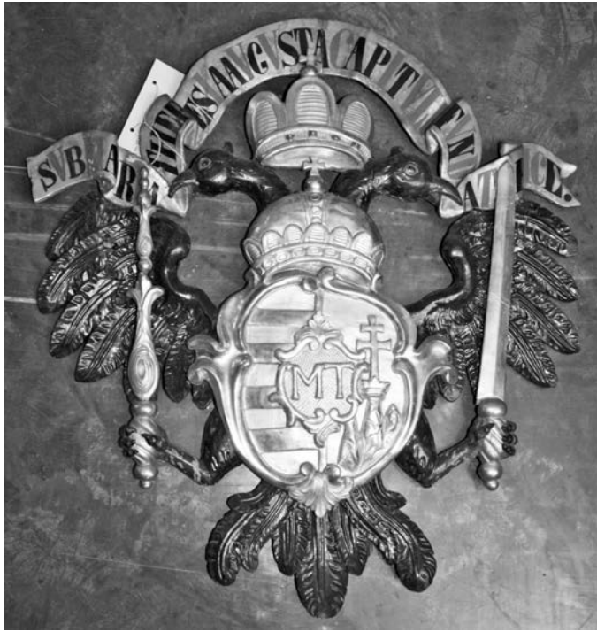
11. kép. Kétféjű sas a Magyar Királyság címerével és a soproni káptalan megalapítására emlékeztető felirattal a Szent György-templomból. 1780, Soproni Múzeum

a káptalan alapítójaként emlékeztetett a királynőre. Egy 1834. évi útleírás szerint a faragvány a templom főoltára fölött függött, majd később a Soproni Múzeum gyűjteményébe került, ahol ma is őrzik (11. kép). 187