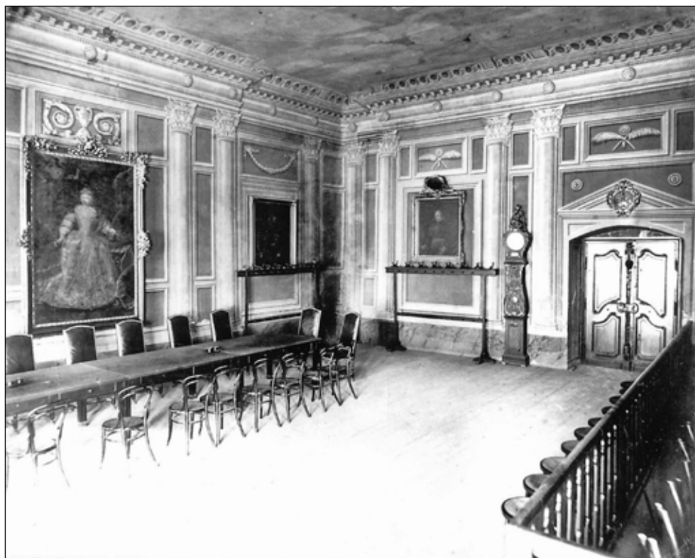
10. kép. A soproni városháza közgyűlési terme. Rupprecht Mihály felvétele, 1890 k. Magyar Építészeti Múzeum és Műemlékvédelmi Dokumentációs Központ, Fotótár, ltsz. 166.197N

portrégaléria festményeinek nagy része – a tanácsterem más berendezési tárgyival együtt 142 – a Soproni Múzeum gyűjteményébe került, ahol ma is őrzik azokat. 143 Az 1896-ban egyesített Sopron vármegyei és városi múzeum 1897-től az új városháza II. emeletén működött. Az ekkor megnyílt állandó kiállításon a Habsburg képmások nem