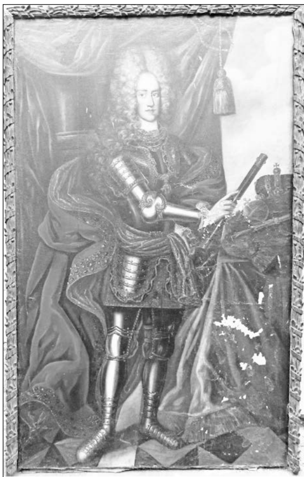
6. kép. Ismeretlen festő: VI. Károly portréja a régi soproni városháza tanácsterméből, 1716. Soproni Múzeum

(210×138 cm) valamivel nagyobb az előzőeknél, keretük azonos díszítése egységes megjelenést biztosított számukra. A portré páncélban, kezében marsallbottal, a császári sereg tábornagyaként ábrázolja a császárt, 120 minden bizonnyal összefüggésben azzal,