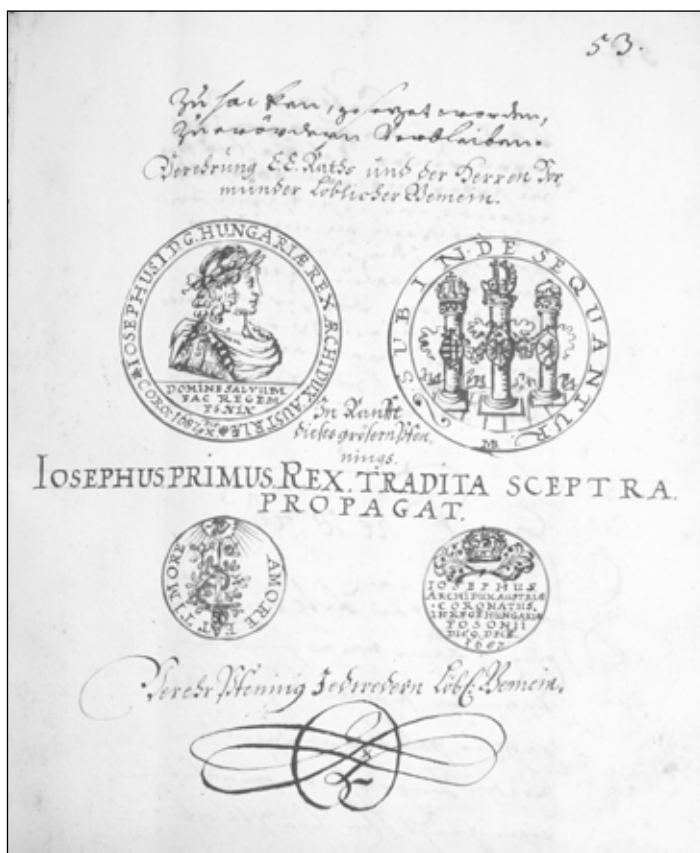
1. kép. I. József koronázási emlékérmének és koronázási zsetonjának rajza Sopron város 1688. évi tanácsülési jegyzőkönyvében

háza, amely a nyomtatványban emblémaként kialakított jelképes lőtáblaként, szőlővesszővel és feliratokkal övezve jelenik meg. (2. kép) A címer körüli feliratok a város címer sisakdíszeként megjelenő kétféjú császári sas oltalmazó szerepét hangsúlyozzák, 50 míg a címert övező, fürtökkel teli szőlővessző a város gazdasági bázisát képező bortermelésre utalnak. Az embléma jelentését a kronosztichonos köriratként megjelenő subscriptio foglalja össze: PAX NOSTRIS FAUEAT PORTIS ET MOENIA SIGNET DVLCIOR EST UVIS PAX BONA SOPRONIIS [1698] (Kedvezzen kapuinknak a béke és mutassa a városfalakon, hogy a szőlőfürtöknél édesebb a jó béke a soproniaknak). Az embléma üzenete tehát az,