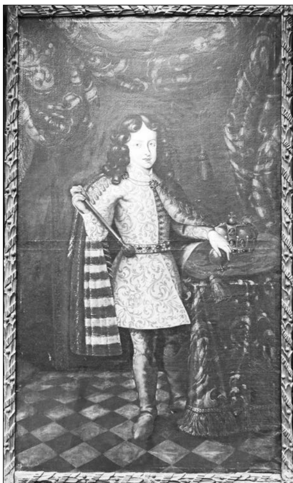
5. kép Ismeretlen festő: I. József portréja a régi soproni városháza tanácsterméből, 1692. Soproni Múzeum

VI. Károly portréját 117 1717-ben, az evangélikus vallású Unger Mátyás 118 polgármestersége alatt 20 ft-ért vásárolta Sailer György Vilmos belső tanácsos, későbbi polgármester Bécsben egy ismeretlen festőtől, majd a város Leitner Szervác soproni szobrásztól rendelte meg a kép aranyozott, szalagfonatos díszkeretét (6. kép). 119 Bár a kép mérete