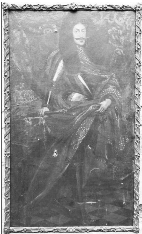
4. kép. Ismeretlen festő: I. Lipót portréja a régi soproni városháza tanácsterméből, 1692. Soproni Múzeum

nyei, a korona, a jogar és az országalma a háta mögött egy konzolasztalon, vörös bársonypárnára helyezve jelennek meg. 116 I. József portréja gyermekként ábrázolja az 1687-ben, 9 éves korában magyar királlyá koronázott trónörökösöt, mégpedig abban a magyaros díszruhában – csizmában, dolmányban és mentében – amelyet pozsonyi koronázása során viselt. Balján, egy konzolasztalon, vörös bársonypárnára helyezve a magyar királyi korona és az országalma látható, jobbjaiban a királyi jogart tartja.