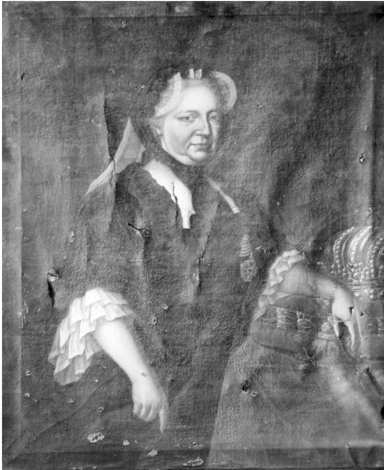
12. kép. Mária Terézia gyászruhás portréja, 1780. Sopron, Szent György Plébánia

ben, amely 1742. július 1-jén hangzott el, Mária Terézia győzelméért könyörgött a cseh trónért folytatott örökösödési háborúban, a másodikban pedig, amely 1743. július 7-én hangzott el a Szent Mihály-templomban, a királynő május 12-én tartott prágai koronázásáért mondott hálát. 189 1781. január 17-én a domonkos templomban gyászmisét tartottak és castrum doloris emeltek Mária Terézia emlékére. 190